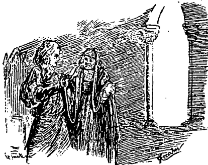
Ilustracion al VI o auto por Escobar. Barcelona, 1888.

[158]... illico me interpellato ne quid desit. Quod ad processum ulteriorem attinet, in occulto acta sunt; proinde nil temere pronunciandum. Executio forsitan sponte prodibit, et.