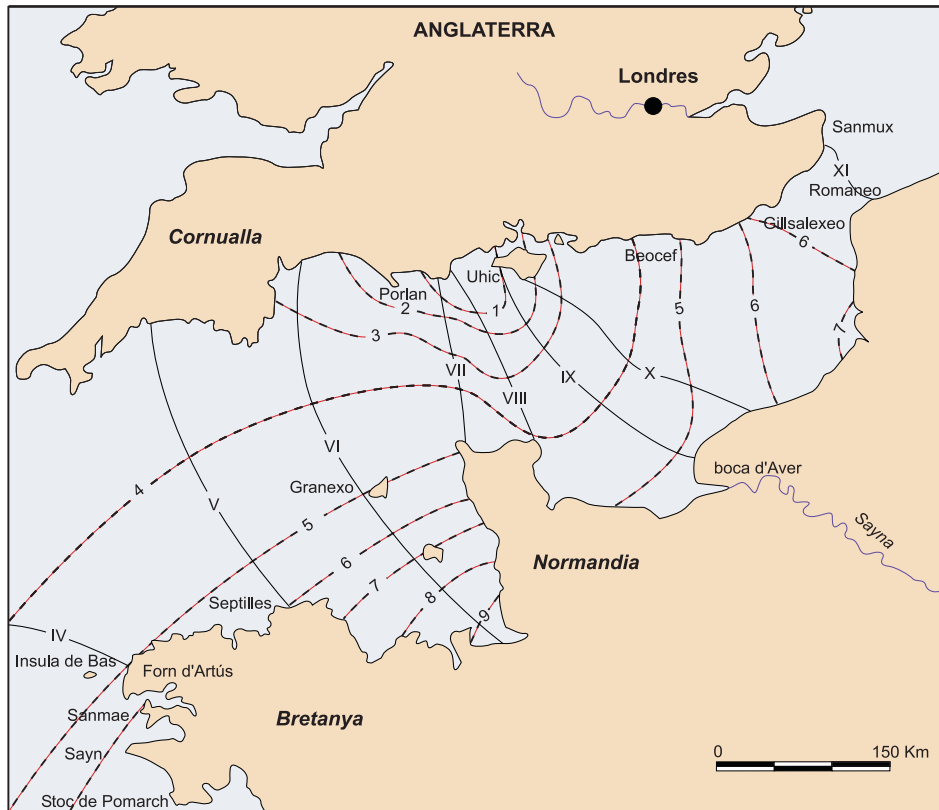
Fig. 3. Mapa del canal de la Mànega amb els topònims considerats a l'Atlas català i les línies cotidals. Les línies contínues representen cotidals (igual alçària de marea) en hora lunar i les línies de traços, l'amplitud (semidesnivellament) de la marea en metres.

tristament famós al mapa de naufragis atlàntics; raz o rash , en vell anglès, ræsc , vol dir tant 'tempesta', 'corrent violent' com 'estret' o 'freu', que és el nostre cas (GUILCHER, 1950; 1979). Sanmae –inicialment 'pedra santa'– correspon a la Pointe de Saint Mathieu, avançada que també suporta un gran far al costat de les ruïnes d'una abadia benedictina. Forndartus , forno a l'Atlas pròpiament dit, s'identifica amb el topònim actual Le Four, aplicat al freu molt perillós que separa l'avançada extrema de Bretanya –punta de Saint Mathieu i Kerk-Leon = Le Conquet– de l'arxipèlag de Molenez i d'Eusa (Ouessant); P. Vesconte (1321) escrivia fornato , mentre que la grafia preponderant el segle xv és la de Cresques Abraham; després, les males lectures poden arribar a torno o torn . 11 Insula de bas es conserva actualment en