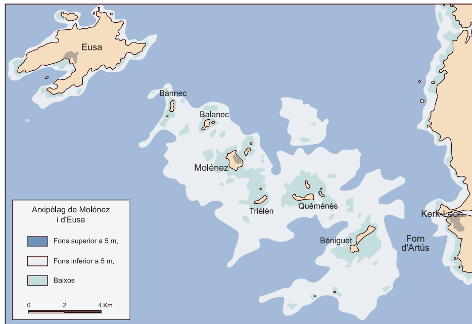
Fig. 4. L'arxipèlag de Molénez i d'Eusa, on radica el Forndartus , un dels passos més perillosos de la Mànega, a causa dels corrents de marea.

bretó com a Enez Vaz , davant de Rosko. Setrilles correspon[en] a l'arxipèlag de les Sept Îles, ar Jentilez en bretó; l'arxipèlag només té cinc illes i una munió d'esculls, de manera que les 'set illes' són una falsa etimologia que encara no vigia el 1375. Granexo és l'illa britànica de Guernsey, ben topadissa per als navegants, abans d'arribar a ras branzard (Raz Blanchard). Aquest topònim té una palesa etiologia basada al fort corrent habitual entre l'illeta d'Alderney (Aoeur'gny o Aurigny) i el cap de la Hague, a l'extrem del Cotentin; la velocitat mitjana és de vuit nusos i durant les mareas altes equinoccials pot atènyer els dotze: això no podia passar per alt als mariners medievals.