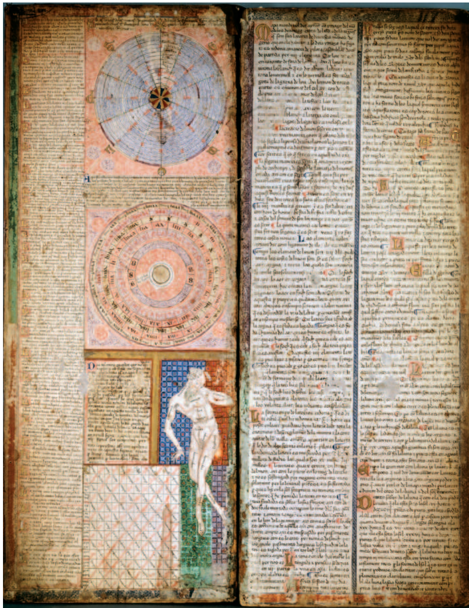
Fig. 1. El primer panell de l'Atlas català de Cresques Abraham. A dalt s'hi veu la roda de les mareas que comentam i, a la columna de la dreta, el text corresponent. (Paris, Bibliothèque nationale, Ms. Esp. 30).