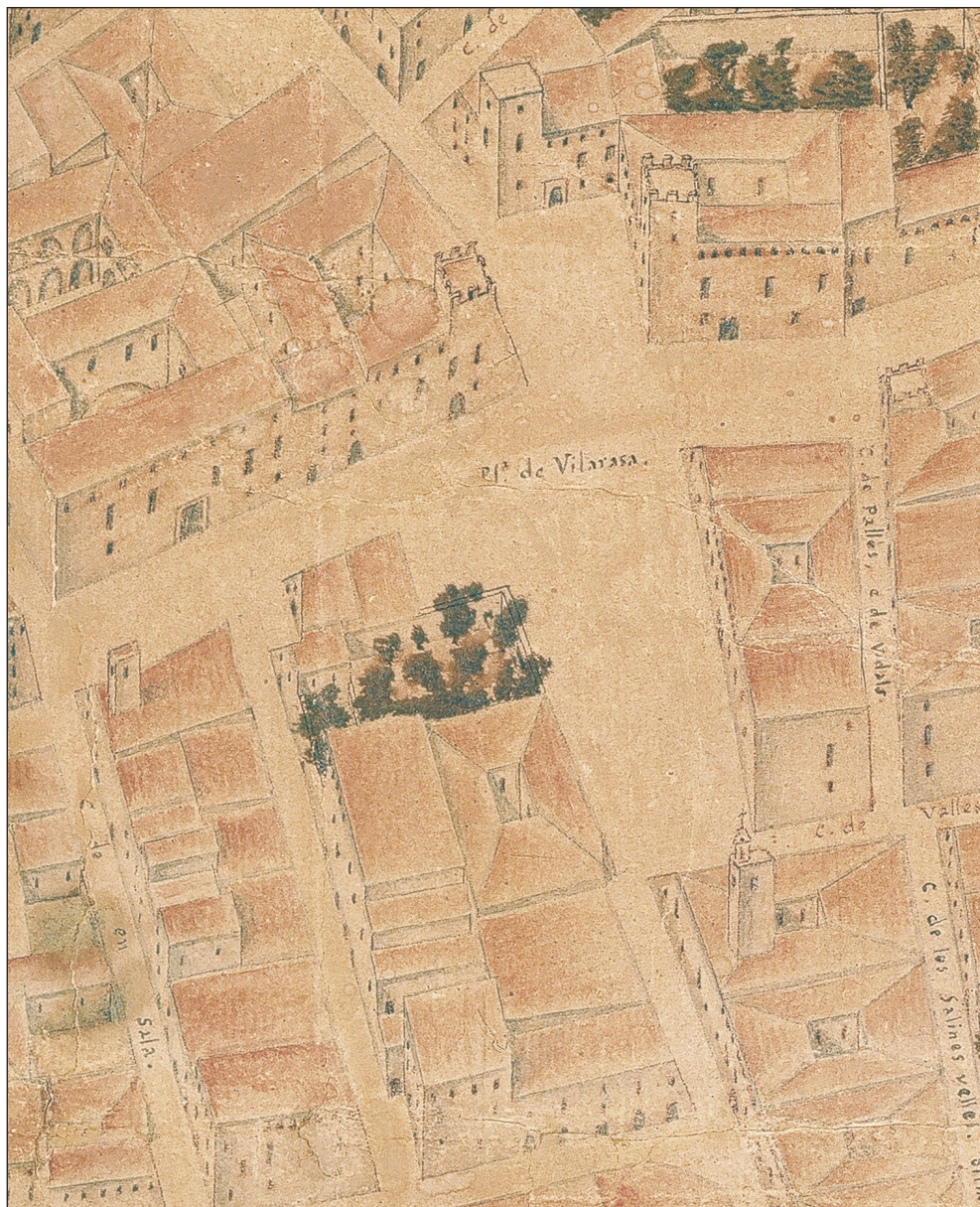
Fig. 5. Plaza Vilarasa en el plano de Valencia de Tomás Vicente Tosca (1704) (Valencia, Museu Municipal, Ajuntament de València)