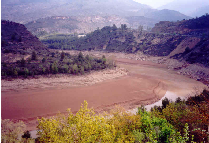
Figura 2. Sedimentos en el embalse de Camarasa, Noguera Pallaresa, Pirineo Central. Presa construida en 1920