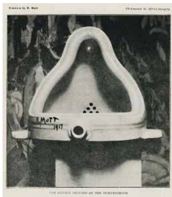
Figura 4: “A Fonte” foi o título dado ao urinol assinado e datado por Duchamp como “R.Mutt, 1917” e imortalizado pela fotografia feita por Alfred Stieglitz em seu estúdio.

Peter Bürger, em seu livro Teoria da Vanguarda , analisa a arte durante o modernismo e nos mostra como as ações das vanguardas dos anos 20 puderam influenciar a vanguarda norte-americana dos anos 60. A vanguarda dos anos 20 atacou a “grande arte” baseada na tradição esteticista do final do século XIX, o realismo e a separação que se fazia entre arte e vida. Quando Duchamp assinou um urinol ou uma garrafeira, que são produtos em série do mercado, ele desprezou e ironizou a pretensão de criação individual do artista. Segundo Bürger(1993), “Os ready mades de Duchamp não são obras de arte, mas manifestações.”