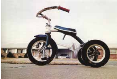
Figura 9: “Memphis”, 1971, fotografia do livro Guia de William Eggleston, 1976.

cartões postais e publicou seu livro American Surfaces (Superfícies Americanas). Eggleston e Shore abriram as portas para a criação de uma fotografia mais livre e sobretudo, contribuíram para que o uso da cor na fotografia pudesse ser um padrão. Nessa época, surgiu o cibachrome , um papel fotográfico à base de poliéster que permitia a ampliação, a partir de positivos ( slides ), ao invés de negativos, e, proporcionava cores mais saturadas. Tudo em oposição ao p&b formal da era modernista.