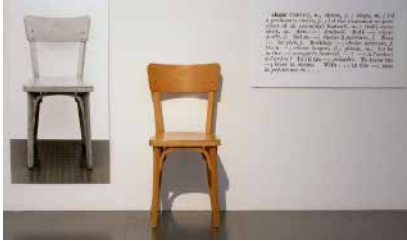
Figura 6: “Chair”, 1965, de Joseph Kossuth, Kunstmuseum, Lucerna.

Refletimos sobre alguns exemplos de artistas que se utilizaram da fotografia para a delimitação de suas práticas artísticas e seus processos criativos. Poderíamos mostrar muitos outros, como exemplos de artistas conceituais: Joseph Kossuth questionou as possibilidades tautológicas do discurso artístico, com suas três cadeiras mostradas como objeto material, enunciado normativo e reprodução fotográfica. Um discurso que reverbera nele mesmo.