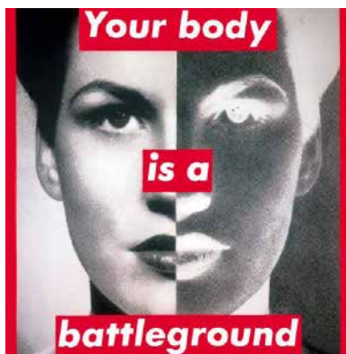
Figura 5: Com “Your body is a battleground”, Barbara Kruger coloca na ordem a legalização do aborto.

Exemplo da influência do feminismo é a artista Barbara Kruger que trabalha gênero em suas colagens. Ela mistura fotografias apropriadas com curtos enunciados. Produz outdoors e cartazes em pontos de ônibus com fotografias e frases que levam os homens a se colocarem no lugar das mulheres, chama atenção para a luta feminina. Há uma provocação para o fruidor: “..., Kruger propõe enunciados linguísticos que levam à problematização do sujeito da enunciação e da função imperativa da linguagem, recorrente na publicidade.” (Fabbrini, 2002:147). Tudo leva a crer, que a artista se inspira no construtivismo russo e no designer da Revista Life para criar uma diagramação dos enunciados em cima das imagens.