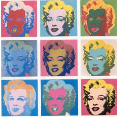
Figura 1: Serigrafias de Andy Warhol com imagens de Marlyn Monroe.

Warhol, a fotografia é a matriz de sua obra: ela é multiplicada – o que contraria o ideário norte-americano da arte como “novidade” – e “serigrafada” com cores fortes e extravagantes trazendo à tona seu caráter simbólico muito mais do que indicial. O processo de repetição das fotografias de Che, Marlyn ou Mao é levado ao extremo por Warhol, pois nega a noção tradicional de arte como expressão de autoria e se utiliza de técnicas publicitárias tão familiares na cultura de massa. 2