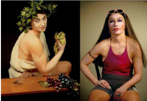
Figura 13: À esquerda, uma referência ao quadro “Pequeno baco doente”, do pintor barroco Caravaggio, datado entre 1593 e 1594, exposto na Gallerie Borghese, em Roma e à direita, Cindy cria um transexual, inquietação na discussão do “feminino”.

Por fim, no “pólo Nova Iorque”, podemos destacar os fotógrafos Richard Prince (1949), Cindy Sherman (1954), e Nan Goldin. Cindy Sherman combina elementos incongruentes e cria uma imagem caótica tirando a segurança natural do espectador, suas fotos produzem inquietação. Ela brinca com os estereótipos e com os arquétipos, como por exemplo, quando faz alusão às pinturas de Caravaggio. Ela é ao mesmo tempo fotógrafa, modelo, produtora, maquiadora e cabelereira. Ela cria seus personagens usando próteses (de nariz, de seios, etc.) e roupas de época, ela coloca em xeque o realismo, ela encara a encenação e a identidade construída, por isso, não podemos dizer que suas fotografias são autorretratos.