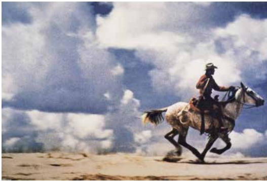
Figura 15: "Untitled Cowboy", 1989, chromogenic print, 127 x 177.8cm, fotografia de Richard Prince que está no The Met – Metropolitan Museum of Art, NY.

Prince manipula la apariencia hiperrealistas de estos anuncios hasta el punto de desrelajarlos en el sentido de la apariencia, pero realizarlos en el sentido del deseo. (Foster, 2001:150)