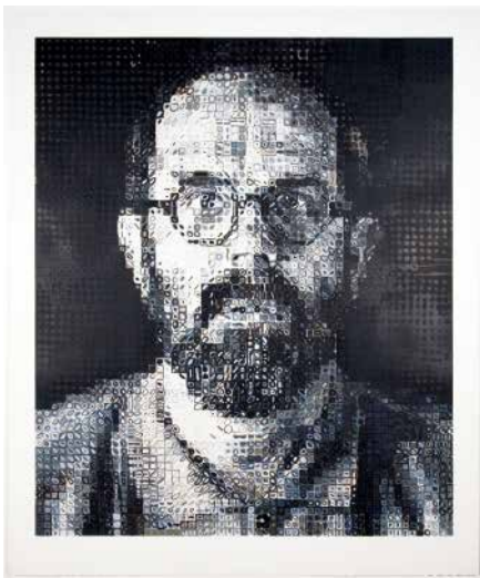
Figura 3: Autorretrato, 1991, de Chuck Close. Óleo sobre tela, MoMA, NY.

Podemos dizer que os artistas hiper-realistas também se utilizaram de forma direta da fotografia fazendo o movimento contrário que os pictorialistas faziam quando tentavam intervir com determinadas técnicas nas cópias fotográficas para aproximá-las às pinturas ou gravuras. Podemos dizer que “el pintor hiperrealista ejercia em primer lugar, una mirada de fotografo – mirando o mundo a partir de una fotografia –, para después ‘elegir’ e traducir en términos pictóricos la imagen original” (Sougez, 2007:544). O artista partia de um original fotográfico, às vezes de projeção de slides, para pintar o mais próximo possível do “real”. Como disse Dubois (2010:274), “ aqui a pintura se esforça por tornar-se mais fotográfica que a própria foto. ”