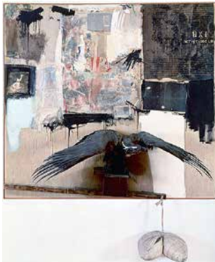
Figura 2: Obra tridimensional (MoMA) do artista Robert Rauschenberg.

Podemos destacar também do pop americano, o artista Robert Rauschenberg que parte das referências das vanguardas históricas (Hanna Höch e as fotomontagens dadaístas) e usa a fotografia oriunda dos meios de comunicação para a feitura de suas combine paintings . As colagens tridimensionais com objetos e imagens fotográficas apropriadas, aparentemente descontextualizadas, ao se juntarem, produzem um trabalho pictórico com sentido e característica da pós-modernidade.