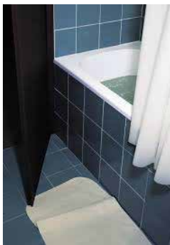
Figura 11: Bathroom(Beaus Rivage), de 1997, por Thomas Demand.

O processo criativo e o procedimento utilizado por Demand, segundo Fried(2010), consiste em selecionar uma imagem da mídia, por exemplo, alguma cena de um crime. Depois ele faz uma maquete tridimensional em papel e em tamanho real da cena em que se inspirou e, então, a fotografa com uma câmera de grande formato. Assim, obtém por intermédio de câmeras mais potentes, ampliações em tamanhos maiores e aumenta a ilusão da realidade com maior verossimilhança. Num primeiro momento, o espectador vê uma imagem fria e abstrata, mas num segundo olhar, percebe que algo está “fora do lugar” e começa a ver pistas de que a imagem é uma simples reconstrução. O artista parte da escultura, se, considerarmos as construções de suas maquetes como tal, e elas são isentas de qualquer vestígio de tempo, o que contraria o “momento decisivo bressoniano” e “dishistoriza” a fotografia, a tira do contexto do espaço/tempo.