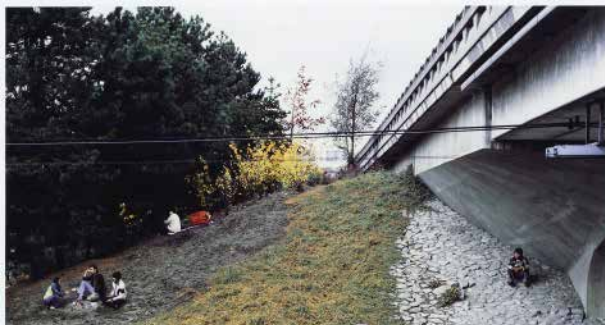
Figura 12: Fotografia The Storyteller (O contador de histórias), de Jeff Wall, feita em Vancouver, 1986. Silver dye bleach transparency in light box, Image: 229 x 437 cm, The Met – Metropolitan Museum of Art, NY.

Outra imagem de Jeff Wall, que pode ilustrar muito bem seu processo criativo, é sua famosa fotografia de 1992, Dead Troops Talk – “Conversa de soldados mortos (Visão após uma emboscada contra uma patrulha do Exército Vermelho perto de Moqor, no Afeganistão, no inverno de 1986)” –, onde o fotógrafo, que nunca foi ao Afeganistão, encenou e construiu todo o cenário em seu estúdio, dirigindo cinematograficamente os atores em suas posições. Fontcuberta (2010) nos disse que o melhor fotógrafo é aquele que mente bem, alusão ao fato de que toda fotografia traz consigo a criação e a manipulação como essência e característica.