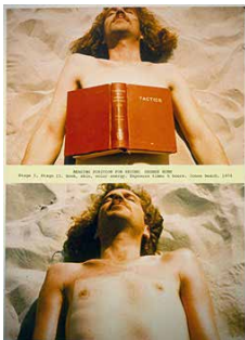
Figura 8: Dennis Oppenheim ao sol.

Ou, por exemplo, Gina Pane quando em suas performances executou feridas no seu próprio corpo e tem tudo minuciosamente fotografado. O mesmo podemos dizer da obra de 1970 de Dennis Oppenheim: o artista se expôs ao sol pousando um livro aberto em seu dorso nu durante várias horas. O antes e depois foi fotografado e o próprio ato do artista mostrou seu corpo como uma película fotográfica sensível à luz.