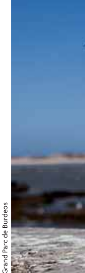
Grand Parc de Burdeos

«EN NUMEROSAS ESPECIES LA DISPERSIÓN ESTÁ SESGADA A UNO DE LOS DOS SEXOS, LO QUE PARECE UNA FORMA PERFECTA DE EVITAR LA CONSANGUINIDAD»