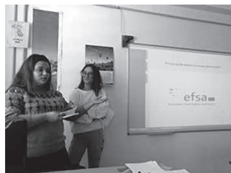
Fig. 2. Imatges de les exposicions de les investigacions dutes a terme pels alumnes.