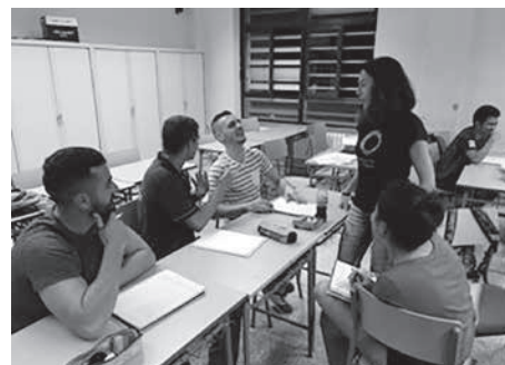
Fig. 1. Imatges en que es mostra la fase de formació i sensibilització del projecte.