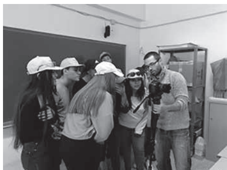
Fig. 3. Diferents moments de la gravació.

S'observa com l'alumnat en un context diferent de les activitats més habituals de classe troba el seu lloc a l'hora de fer la filmació, alguns ajuden al càmera, d'altres volen ser protagonistes o actors secundaris, d'altres s'ofereixen a ballar o dur material pel rodatge; tot és vàlid si es participa!