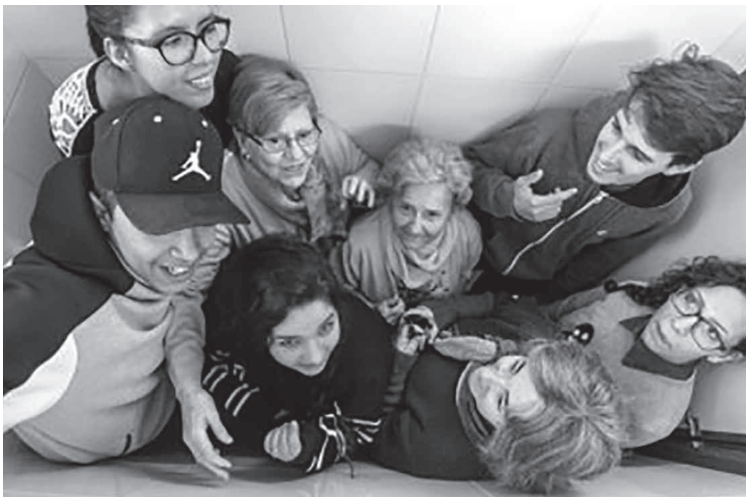
Fig. 6. En el projecte coexisteixen diverses generacions, donant al projecte un caire intergeneracional.