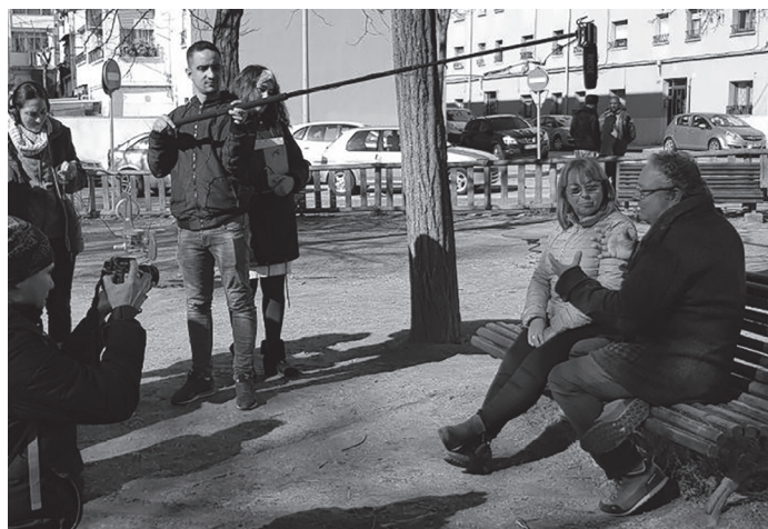
Sessió de rodatge del documental a GES (març de 2019)