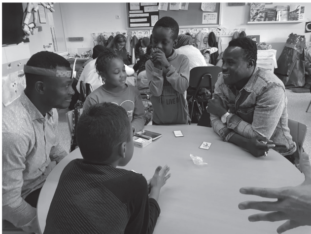
Grup de treball del primer dia d'intercanvi amb l'alumnat del grau de Nutrició Humana i Dietètica de la Universitat de Vic (febrer de 2019)

Per acabar podem dir que aquestes experiències recullen la filosofia del centre en relació al concepte educació, que és vetllar per un model d'escola que entén la diversitat com una riquesa, vinculat a l'entorn social i cultural i obert a la comunitat.