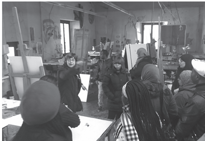
Visita de l'alumnat de Llengua catalana 2 a l'Escola d'Art i Superior de Disseny de Vic, dins l'eix temàtic "La feina" (novembre de 2019)