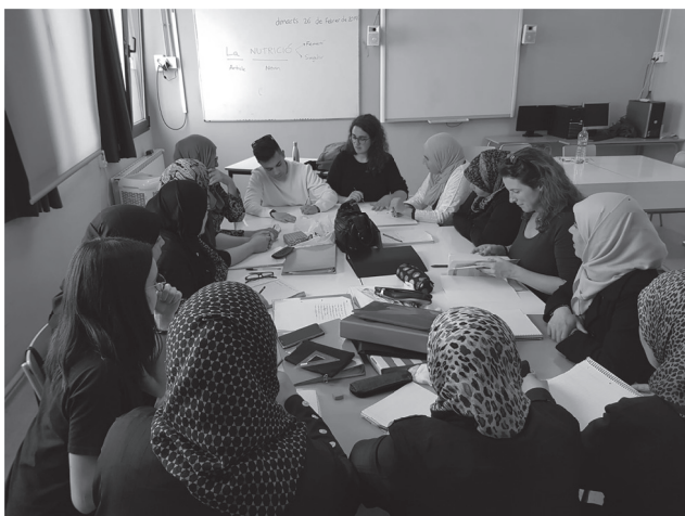
Segona sessió amb jocs lingüístics de l'intercanvi escolar amb l'Escola Vic Centre (abril de 2019)