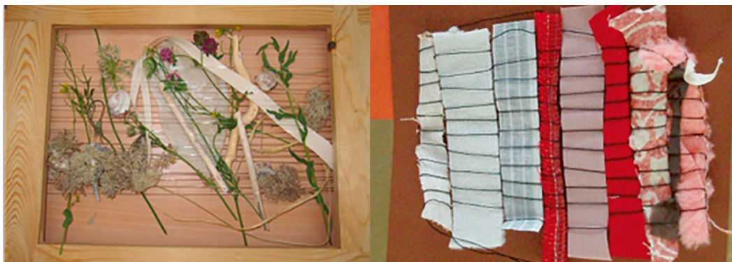
Imatge 11. Alfabetos emocionals elaborats al taller d'educació intercultural

Així, doncs, una qüestió important que sorgeix en aquests projectes és: com treballar per evitar l'exclusió sense caure en un discurs dominador? Ens hem de plantejar projectes formatius que qüestionen els sabers instituïts, que promoguen una nova mirada sobre els discursos i subjectivitats que ens envolten, des d'una altra perspectiva que estranye el quotidià, de manera que es desencadene un procés de crisi que pugui desembocar a la construcció col·lectiva de nous coneixements.