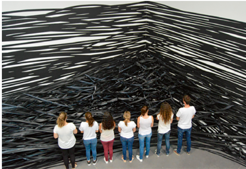
Imatge 1. Aprenem de manera situada. Espai d'Art Contemporani a Castelló

Des de la psicologia social ens arriba una idea que ens pot ajudar en aquest sentit: l'aprenentatge situat, com a revisió constructivista que supera la idea d'aprenentatge significatiu, més individualista i descontextualitzat. Ens apropa a l'imaginari de comunitat de pràctica, com la manera de socialitzar el coneixement i l'acció. Fer i conèixer, aprendre de manera situada, els uns dels altres, des de la participació, la cooperació i el lideratge compartit, amb una mirada més horitzontal i dialògica de l'aprenentatge i de la relació entre éssers humans (Sagástegui, 2004).