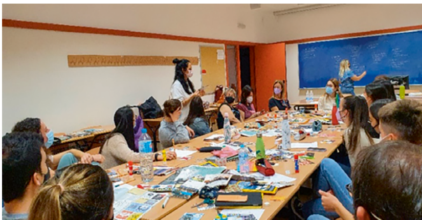
Imatge 8. Seminari del col·lectiu ideadestroyingmuros per a Orientadores

És una forma de millorar el que fem i generar processos creatius (Jové, 2009), entesos com a processos col·laboratius que incorporen les contribucions de diferents actors, cadascun dels quals participa de forma única en el desenvolupament de les idees (Clapp, 2018, 17). Per això, cal que els docents en el procés creatiu trenquen amb la tendència a afavorir certes capacitats cognitives, trets de caràcter i destreses per sobre d'altres, i que, alhora, trenquen amb les cultures de poder que perpetuen els plantejaments tradicionals i individualistes de la creativitat i de l'art.