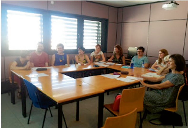
Imatge 3. Seminari de Ciutadania Crítica. Universitat Jaume I

Aquest enfocament de la formació de les persones adultes respon a l'exigència ètica de tota societat democràtica de respecte als drets de tota la ciutadania i de la seua representativitat a la vida social i política.