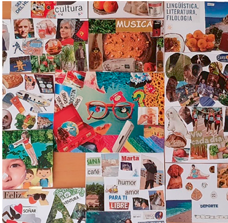
Imatge 10. Collage de presentació del grup-classe curs 2022-23.

Els projectes basats en l'art promouen el canvi, connectant les necessitats de la comunitat amb els recursos i la capacitat de sostenibilitat des del respecte a l'entorn i d'accessibilitat (García Morales, 2017). Permeten percebre els problemes socials derivats de la injustícia social i raonar de manera crítica possibles solucions col·laboratives, amb l'objectiu de prevenir prejudicis i actituds racistes o sexistes (López-Ganet, 2021; Saura Pérez, 2018).