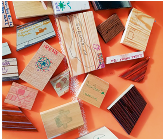
Imatge 4. Decolonitzar la mirada des d'una ecologia de sabers

Decolonitzar la nostra mirada vol dir reconèixer altres sabers, rescatar el discurs dels grups subalterns, colonitzats, les epistemologies del sud. Boaventura de Sousa Santos (2019) apunta que aquest pensament que excedeix els paràmetres imperia-listes i occidentals com a universals, dóna valor al coneixement negat i silenciats. Des d'aquesta mirada decolonial, les persones adultes passen a ser subjectes que creen coneixement, que representen el món com a seu i que tenen capacitat de transformar-lo mitjançant el diàleg de l'ecologia de sabers i el reconeixement del valor de la diversitat de sabers dels grups humans més allà del coneixement científic.