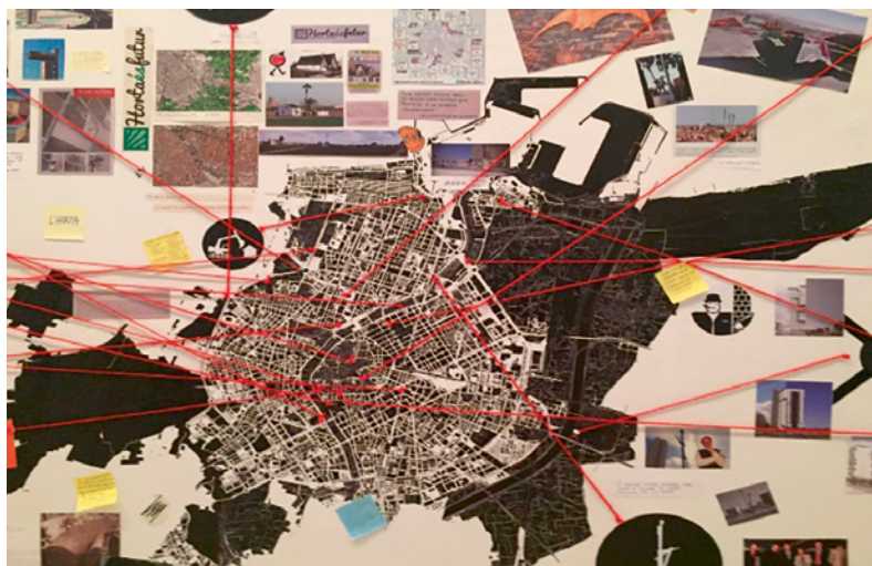
Imatge 5. no/w/here: valencia. Radical Geographics. Rogelio López Cuenca. IVAM