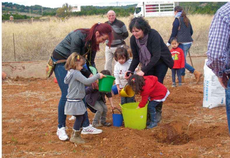
Imatge 2. Projectes de treball intergeneracionals. CRA Benavites-Quart de les Valls

Allò que aprenem suposa una experiència que uneix les persones per sobre de les diferències de temps, lloc i intensitat, però no significa un pla idèntic per a tothom. L'aprenentatge respon a la diversitat cultural, per tant, l'educació es desenvolupa i té la raó de ser com a resposta democràtica i tolerant amb la pluralitat cultural. La formació rebuda es pot considerar com la base cultural compartida, però no ha de ser exactament igual per a tothom, pot tenir pluralitat interna, és a dir, s'ha de centrar en allò que ens uneix i ens pot unir, prenent perspectives dels altres. És un mitjà per ajudar a la igualtat d'oportunitats en el sentit que recull allò que és comú i bàsic de cada cultura, creant les condicions per a la igualtat social, mitjançant l'oferta per participar dels béns culturals. Això no vol dir que siga un programa tancat i prescriptiu sinó que ha de deixar un espai a la participació deliberativa dels seus participants.