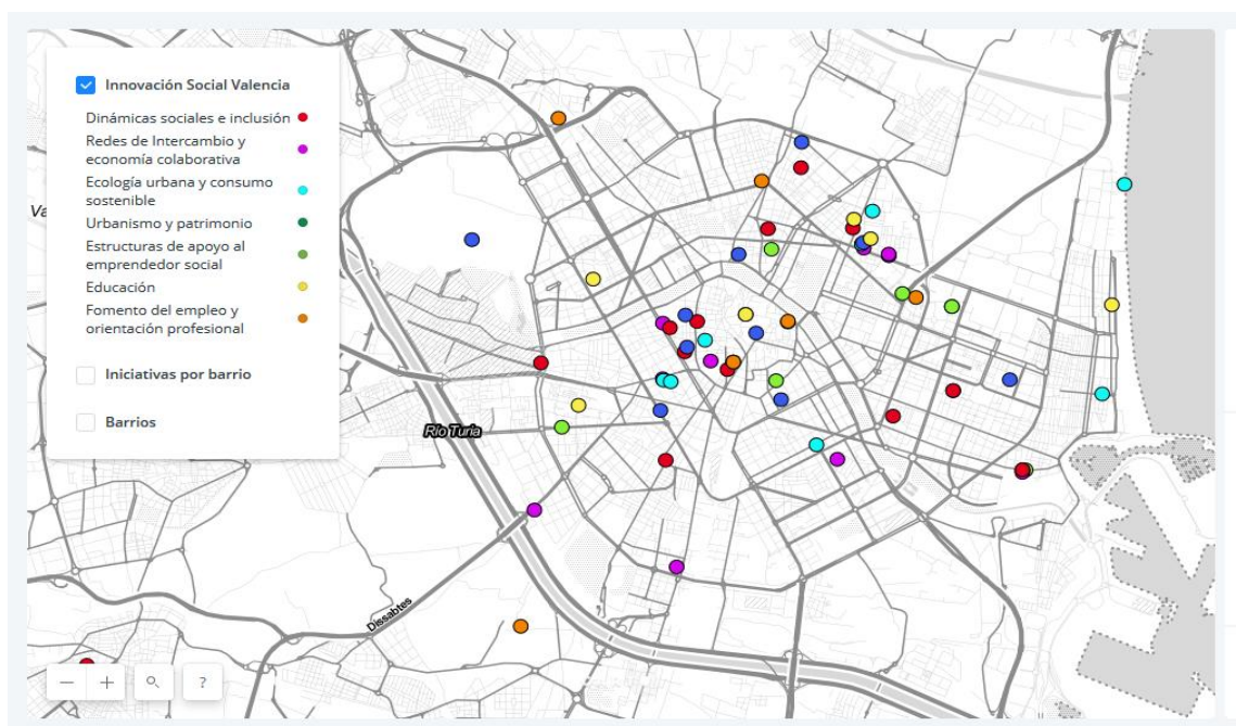
Ilustración 1: Mapa de la Innovación Social en Valencia-Programa CartoDB

Este mapa ha sido incorporado en el Geoportal del Ayuntamiento de Valencia, y puede ser visitado a través del siguiente enlace: https://geoportal.valencia.es/DatosAbiertos/