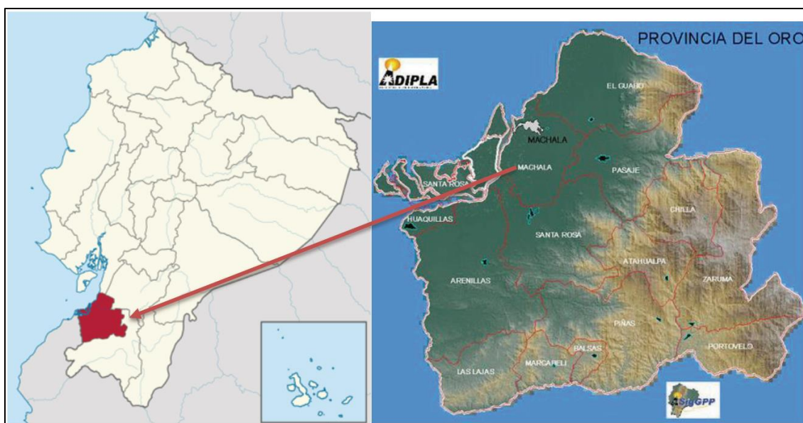
Figura 1: Los 14 cantones de la Provincia de El Oro (Ecuador) y mapa físico