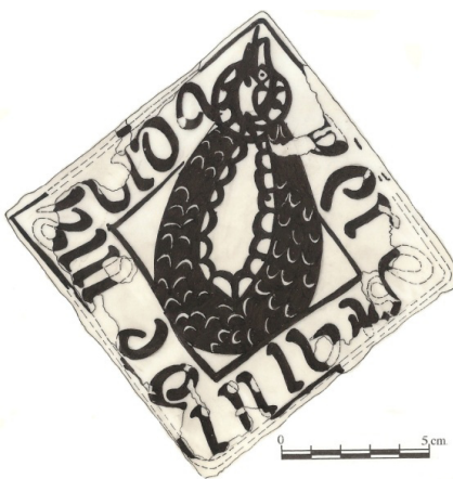
Azulejo con la filacteria Per estalvi de ma vida. Último tercio S. XV.

La modesta pieza en cuestión es un azulejo orientado en losange de 11 cm de lado, decorado con una banda que contiene una filacteria o texto, que corre por los cuatro lados, y un espacio central ocupado por una serpiente estrangulada. Un ejemplar de buena calidad se conserva en el Museo Nacional de Cerámica González Martí, en Valencia, nº de inventario 1-2261.