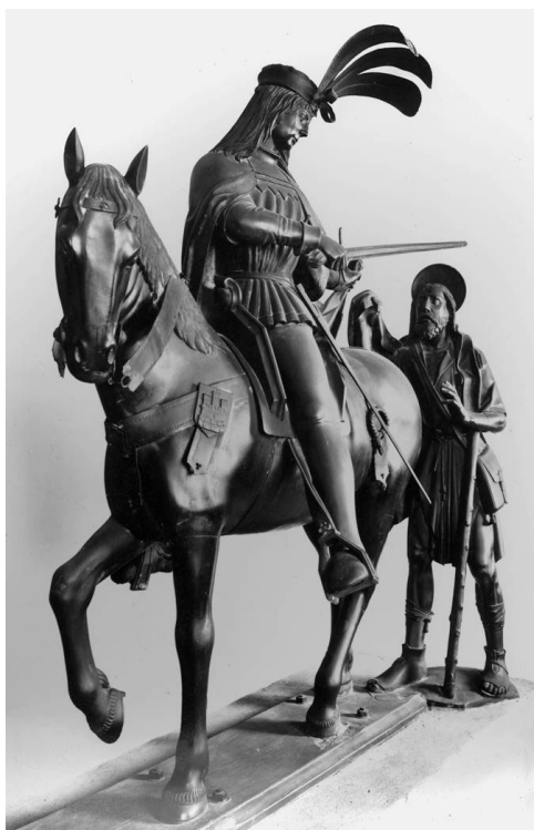
Grupo escultórico del Cavall de Sant Martí.

Y ahora viene la duda que me persigue. ¿Qué miembro en particular de esta élite valenciana contrató y colocó tales azulejos? La pista que hace ya más de 20 años seguí fue la del paralelo con una serpiente, sorprendentemente parecida, que fue esculpida en el grupo en bronce conocido como “el cavall de Sant Martí”, situado en la hornacina que preside la fachada de la iglesia del mismo nombre en Valencia.