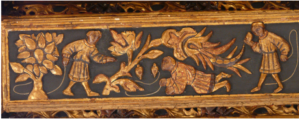
FIGURA 9

clusivamente a que los artífices del alfarje imitaron alguna obra o algún repertorio de “mostres”. Otra opción más factible es que el carácter más popular infriese negativamente en la cantidad de alusiones a esta práctica y que, aunque se jugase, las fuentes no se hicieran excesivo eco. El divertimento con la peonza no fue un tópico literario.