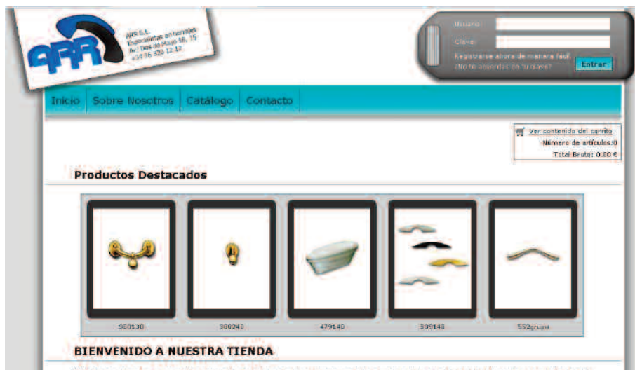
Figura 11. GESFAM: Gestor de facturación con tienda virtual.

Tal y como hemos comentado anteriormente, los proyectos realizados durante el curso 2010-11 son por lo alumnos de 2º de DAI son tres. Para más información sobre su contenido, y sobre las diferentes etapas del plan de empresa, recomendamos ver la wiki de iniciativa emprendedora, en la cual se encuentran alojados todos los proyectos, vídeos y recursos utilizados.