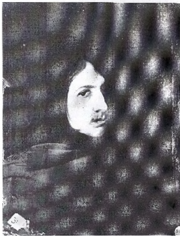
I. Copia de un supuesto autorretrato de Teodoro Ardemans. Madrid, Real Academia de Bellas Artes de San Fernando.