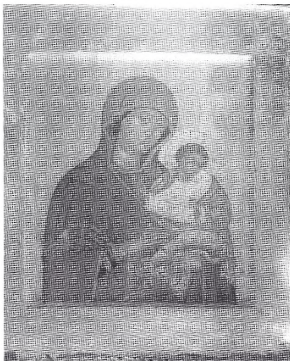
Fig. 4. Virgen de Konevec , 1592. Academia Imperial de las Artes, San Petersburgo.

rresponde a nuestro chorlito real. Su capacidad para detectar la enfermedad es mencionada por Plinio, Eliano, Honorio de Autum, Tomás de Cantimpré, el Fisiólogo griego y latino y el Bestiario de Oxford. Este último asocia el color blanco del ave con la pureza de Cristo, que bajó de los cielos y apartó la mirada de los judíos para dirigirla a los cristianos. 17