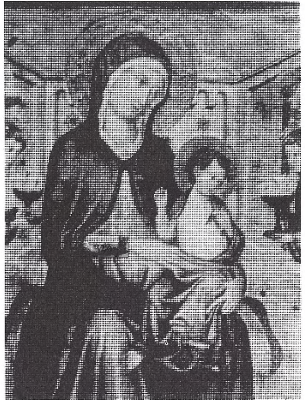
Fig. 6. Maestro de Baltimore: La Virgen y el Niño . S. xiv. The Walters Art Gallery of Baltimore.

A medida que nos acercamos al siglo xv, podemos observar de forma más evidente esa voluntad que ya se apreciaba en la centuria anterior por parte de los artistas, de desprenderse de la rigidez estilística e iconográfica del arte bizantino, y en obras como la Virgen con el Niño de Taddeo di Bartolo, conservada en el Museo del Petit Palais de Avignon o la Virgen entronizada de Carlo Crivelli en la Pinacoteca Brera de Milán, los mo-