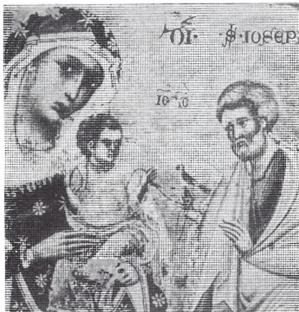
Fig. 5. Anónimo italiano del s. XIV: Sagrada Familia . Colección Sterbini, Roma.

do, por lo que éste le reprendió. Jesús al oír a José dio unas palmadas y dijo a los pajarillos “volad” y al mandato de su voz los doce pájaros levantaron el vuelo. 19 Esta leyenda, muy prodigada en la Edad Media, parece estar en la base de muchas representaciones del Niño Jesús ostentando el pajarillo que fueron realizadas en este periodo.