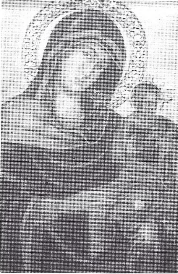
Fig. 1. Nuestra Señora de Gracia . Iglesia parroquial de San Agustín, Valencia.

mos bajo el manto de María en la tabla de San Agustín, un original detalle que solo porta en el ámbito valenciano la Virgen de Monteolivete, no es precisamente un velo, sino una especie de chal, de tejido mucho más tosco y pesado. Es ésta una prenda que, como veremos, aparecerá en casi todas las representaciones del modelo iconográfico reproducido en la tabla de Nuestra Señora de Gracia, aunque, como dijimos, no es frecuente hallarlo en la pintura de iconos, y nos resulta por lo menos llamativo el hecho de que existan dos tablas en la misma ciudad, y parece que de cronología cercana, que presenten distinta iconografía y repitan este original motivo. Motivo que ha sido posible identificar como una prenda que era usada habitualmente por las mujeres para cubrirse el pecho y sujetar y tapan a los niños durante el periodo de lactancia, 3 y, curiosamente, vemos a María luciendo esta toca en dos tablas del siglo XIV que la presentan amamantando al Niño y que se atribuyen a un pintor conocido como Maestro della