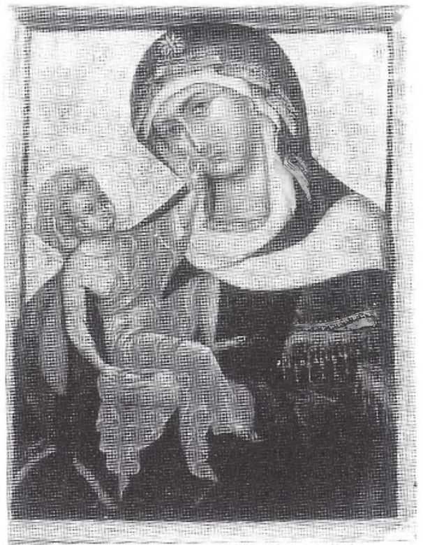
Fig. 2. Nuestra Señora de Monteolivete . Iglesia de Nuestra Señora de Monteolivete, Valencia.

Se le nombra también en diferentes privilegios de los Reyes de Aragón y su fama trascendió fuera de Valencia, y es sabido que en 1370 el propio Enrique II le dedicó una capilla en el claustro pagando su coste y dotándola con tres mil maravedís, según privilegio concedido en Burgos el 17 de mayo de 1372, confirmado más tarde por los Reyes Católicos el 22 de noviembre de 1472. Seis lámparas de plata lucían noche y día ante esta sagrada imagen y, en ocasiones, toda la ciudad llegaba en procesión a los pies de su patrona, la Virgen de Gracia. El 8 de septiembre de 1754 fue inaugurada una nueva capilla más grande, obra de Vergara. Durante la invasión francesa se robaron las joyas de la Virgen y tras la desamortización el convento de San Agustín fue convertido en cárcel, y con este motivo en 1835 fue destruida la capilla de la Virgen de Gracia,