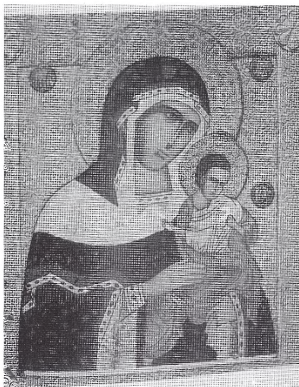
Fig. 3. Escuela de Novgorod: Virgen de Konevec . Finales s. xv. Colección Ostroukhov, Moscú.

chal que se cruza sobre uno de sus hombros. Su mirada, velada por la tristeza quizá de presentir la futura Pasión de su Hijo, se dirige fija al espectador. En su brazo izquierdo sostiene al Niño que, como tal, juega con un pajarillo que sostiene en su mano izquierda y cuya pata está sujeta por una cuerda cuyo extremo toma con la diestra. La Virgen inclina la cabeza hacia el lugar donde su Hijo se encuentra, deja reposar una de sus manos sobre su rodilla, y con la otra le sostiene, tomando delicadamente entre los dedos algún pliegue de su propio manto.