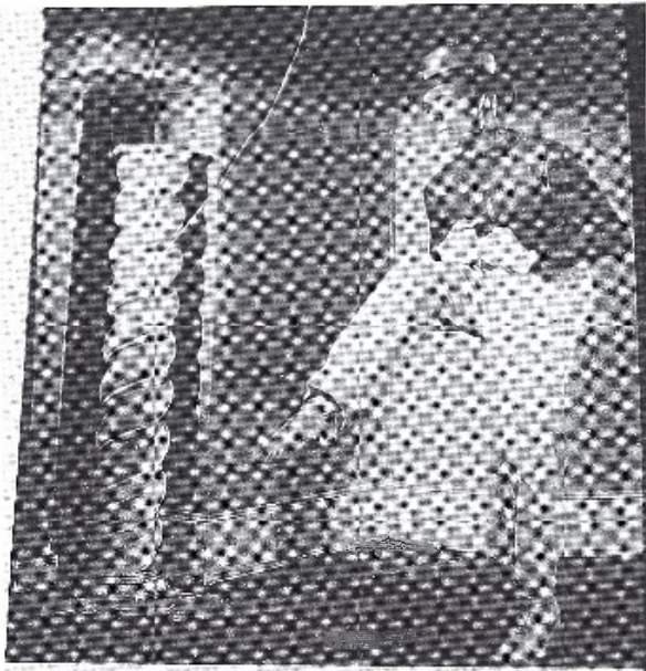
1. Jacques Tati como mimo teatral en su número de equitación.

deudor del “slapstick” norteamericano y sus “personajes-tipo” desde el punto de vista de la comicidad, sin embargo el montaje audiovisual de la película introduce ya algunas innovaciones que nada tienen que ver con el modelo de cine clásico y sí son propias del cine moderno, y que se constituirán en constantes que definirán poco a poco el “estilo Tati”. El film nos muestra los infructuosos esfuerzos de un cartero rural por emular la pretendida eficiencia del servicio de correos norteamericano. Su fracaso provoca la hilaridad de sus vecinos y la burla de los feriantes foráneos encargados de llevar color y alegría al pueblecito. Día de fiesta es, en muchos aspectos, el típico film de evasión francés de la posguerra que, siguiendo la línea de política internacional del general De Gaulle, denuncia la americanización que padecía la Europa socorrida por el “Plan Marshall”. Su personaje protagonista, el cartero François, conforma un caricaturesco catalizador cómico que remite a los personajes graciosos típicos de Sennett y sus discípulos, pero que será abandonado por el cineasta francés que, verdadero autor de sus films, hará uso en lo sucesivo de una creatividad totalmente personal.