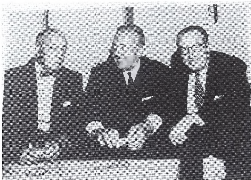
5. Tati flanqueado por Buster Keaton y Harold Lloyd.

para divertirse; los niños, más sabios, hacen de su vida un espectáculo.