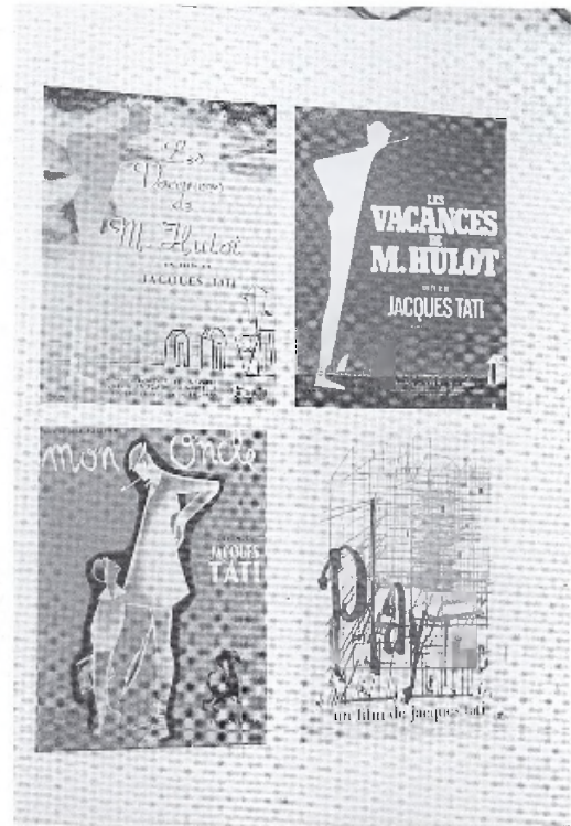
2. Carteles publicitarios de sus films.

– Presencia habitual del gag de reiteración, por el cual la repetición de un efecto cómico y/o la alusión a un gag anterior crean la comicidad. En este sentido, la estética cómica de Tati contradice las teorías tradicionales que consideraban la sorpresa como factor determinante en la construcción de un gag. En Las vacaciones del señor Hulot , por ejemplo, el abrir y cerrar de las puertas del comedor del hotel y su característico sonido conforman un efecto cómico audiovisual que deviene en un “leit-motiv” cada vez más hilarante a causa, precisamente, de su repetición.