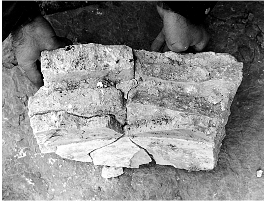
Figura 11. Únic fragment curvilini de resta dels hipotètics esgrafiats que adornaven la mitja taronja de Valldecrist aprofitat en les excavacions arqueològiques.

blanc o gris clar, aquests esgrafiats eren bícroms amb temes també vegetals els dibuixos dels quals perfilaven formes més bé redones que s'entrellaçaven a mode d'espitals obertes, però de diversos colors i combinacions, on destacava l'esgrafiats en clar sobre fons fosc: verd clar, rosa i ocre sobre verd fosc, groc sobre carmí i, contràriament, verd sobre rosa clar.