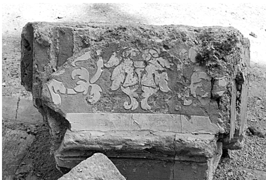
Figura 6. Restat de l'anell de la cúpula de Valldecríst aparegut a les excavacions arqueològiques de 1986.