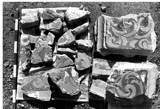
Figura 7. Diversos fragments dels esgrafiatos de les bandes o faixes verticals situades entre les finestres del tambor de la cúpula de Valldecríst exhumats en les excavacions arqueològiques.