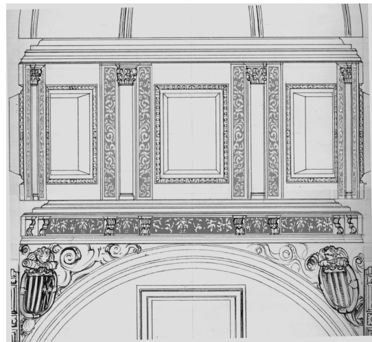
Figura 3. Reconstrucció hipotètica de la cúpula de l'església de Valldecris amb situació dels esgrafiats de l'anell i de les faixes o bandes verticals situades entre les finestres.

és un exemple fefaent d'aquesta adaptació constant al llarg del temps, a més d'un paradigma a l'hora de compartir diversos estils de la mà d'artífexs que treballaren indistintament en els tres cenobis al·ludits. 4