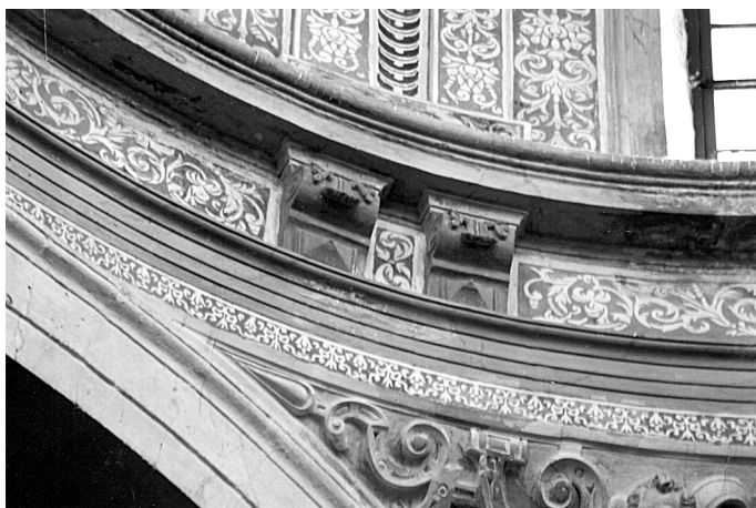
Figura 4. Fragment de l'anell de la cúpula d'Aracristi.

En la mesura en què aquesta aproximació prenga cos, també ho farà el nivell de coneixement de la decoració esgrafiada en un període en què va ser majoritàriament acceptada i difosa per la geogra-