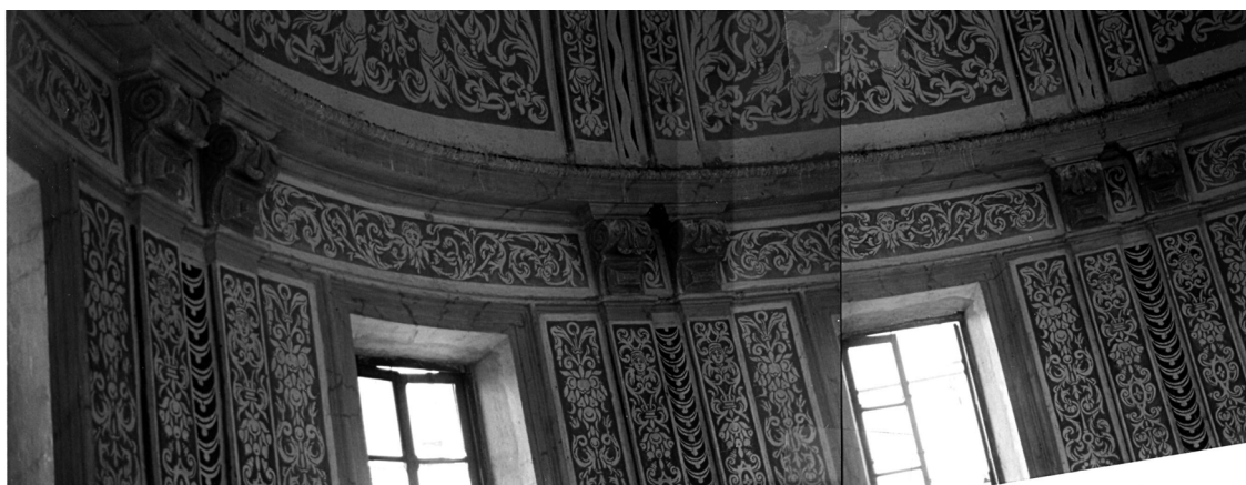
Figura 5. Fragment del tambor de la cúpula d'Aracristi.

fia valenciana i, des d'ací, per altres indrets veïns. Paradoxalment, com s'ha defensat en altres aproximacions sobre el particular, l'esgrafiament vingué a farcir aquests espais (més o menys ambiciosos) i dotar-los d'una vida pròpia que no pogueren satisfer els pintors de l'època, poc o gens familiaritzats amb la pintura al fresc fins les acaballes del segle XVII. 8