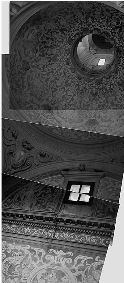
Figura 1. Fotomuntatge d'una part del reraltar d'Aracristi.