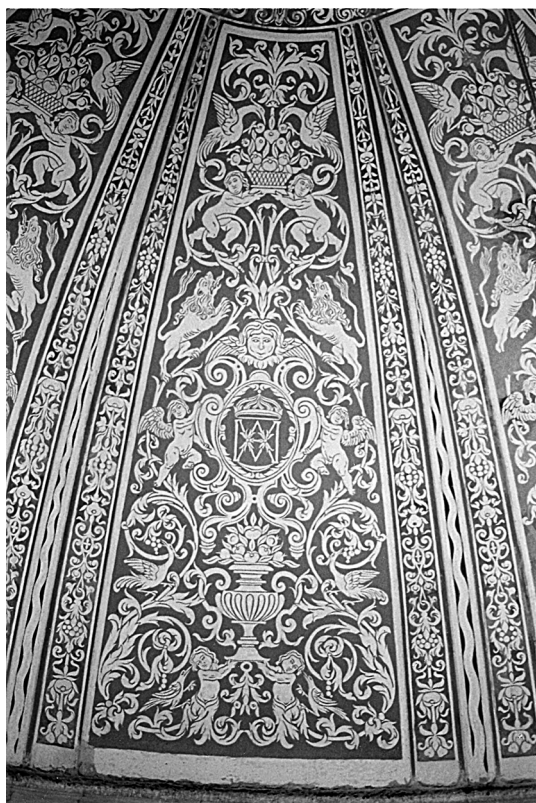
Figura 10. Detall dels esgrafiats de la mitja taronja d'Ara-cristi.

D'acord amb el que hem exposat fins ara, només tenim constància de la decoració amb esgrafiats en la cúpula de l'església de Nostra Senyora dels Àngels. I en aquest sentit s'han trobat indicis arqueològics que demostren fefaentment que aquest repertori ornamental es trobava situat en els següents llocs (de baix cap amunt):