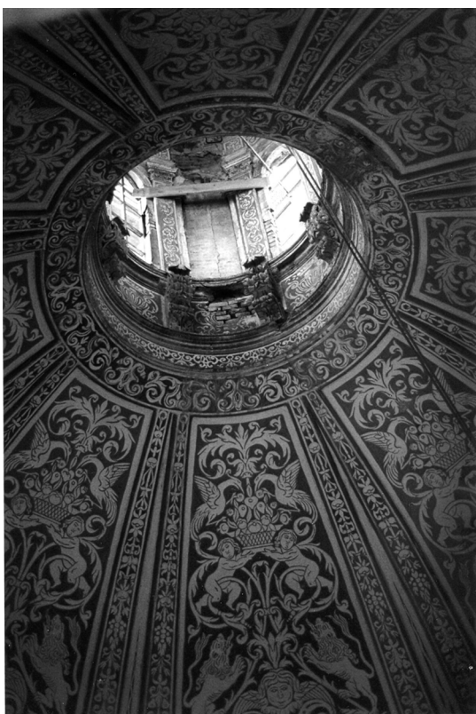
Figura 8. Detall de la part superior de la mitja taronja d'Aracristi amb l'anell circular horitzontal superior i l'inici de la llanterna.

jançant el també reputat mestre d'obres Joan Claramunt (qui reparà posteriorment, en 1674, la mitja taronja del temple del complex del Puig) no deixa lloc al dubte. Les noves experiències foren incorporades a la primigènia estructura gòtica del principal edifici conventual de l'Alt Palància per