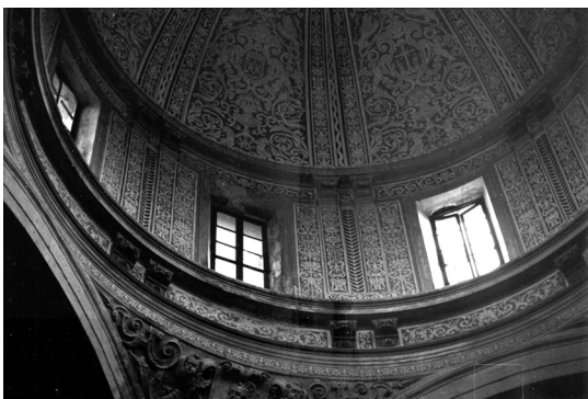
Figura 2. Parcial de la cúpula de l'església d'Aracristi.