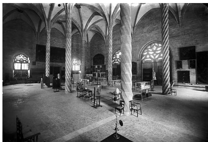
Fig. 2. Interior del Museo provincial instalado en la Lonja de Palma en 1886.

La Orden de 13 de junio de 1844 dio lugar a las Comisiones provinciales de monumentos históricos y artísticos, que reemplazaron las antiguas Co-