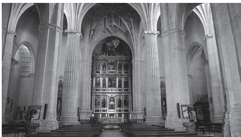
Fig. 2. Iglesia Santiago Apóstol. Interior. Visión desde los pies del templo del altar mayor.

to tan delicado de las obras. Estas opiniones aluden a elementos de la traza de Vandelvira, algunos de los cuales parecen ya estar contruidos como es el caso de los medios pilares situados en la cabecera. Tanto Sancho de Legarra como Juan de Andute recomiendan que estos pilares se desmonten para poder facilitar la visión del altar mayor desde las naves laterales. 17 Por su parte, Martín de Calvidea y Juan Gutiérrez de la Hoceja 18 opinan que puede seguirse la obra conforme a la traza, añadiéndosele simplemente unas gradas a este espacio y adelantando el altar mayor. 19 Tal y como puede apreciarse hoy, estas medias columnas con sus traspilares se conservaron en la embocadura de la capilla mayor, sustituyéndose únicamente el capitel corintio por uno jónico, siendo uno de los pocos elementos conservados del primigenio proyecto de Vandelvira (fig. 2). Por otra parte, uno de los elementos planteados por el alcaraceño que no llegarán a llevarse a cabo es el de la cubrición de la cabecera y naves laterales mediante bóvedas acasetonadas, criticadas por el maestro Juan de Andute por el peso que este tipo de bóvedas pro-