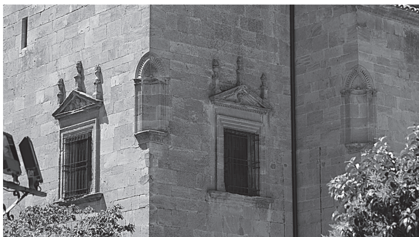
Fig. 6. Fachada Iglesia Santiago Apóstol. Ángulo norte.

tradición moderna y las formas romanas que caracterizará a gran parte de las arquitecturas del periodo en la Península Ibérica. 43