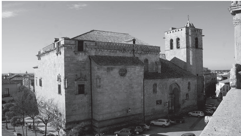
Fig. 1. Iglesia de Santiago Apóstol. Exterior.

rales del templo protegidas por sendos porches. La que se encuentra en el lado meridional responde al estilo tardogótico, abriéndose a la plaza del Pósito mediante un arco carpanel a cuyos lados se sitúan finas pilastras rematadas en pináculos ricamente labrados, todo ello enmarcado por un alfiz. Por su parte, desconocemos cómo fue en origen aquella que se abría en el lado norte, ya que sería modificada a lo largo de los siglos XVII y XVIII más acorde con el gusto clasicista de la época. Por otra parte existe hoy un vano apuntado a los pies del templo que pudo haber funcionado en algún momento como puerta de entrada por su lado occidental. 8 También a los pies quedaría ubicada la torre campanario coronada al exterior por motivos decorativos de bolas, un tipo de decoración común en la última etapa gótica y que se repetirá en otros edificios de San Clemente, tanto religiosos (como es el Convento de San Francisco o la ermita de San Nicolás) como civiles y que puede observarse también empleado con frecuencia en poblaciones cercanas como Belmonte (Colegiata de San Bartolomé) o las Pedroñeras (antigua casa del Ayuntamiento). Al exterior (fig. 1) se hace visible cómo los tres primeros tramos pertenecientes a la primera fase de las obras están contruidos con mampostería irregular y sillares en las esqui-