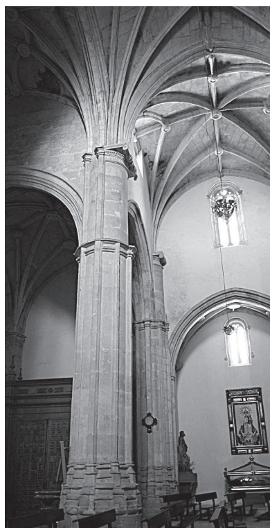
Fig. 3. Transición entre las dos fases de las obras. Las pilastras son elevadas en altura añadiéndoseles medios capiteles jónicos.

Volviendo al trascurso de las obras de la iglesia y como ya decíamos anteriormente, se aprecia cómo a finales de la década de los sesenta la obra venía estando casi acabada especialmente en el espacio de la cabecera, siendo visitada al menos una última vez más por Andrés de Vandelvira y Alonso Barba, tal y como figura en el testamento del primero, 31 quizás durante los años que fue maestro de las obras de la catedral de Cuenca en-