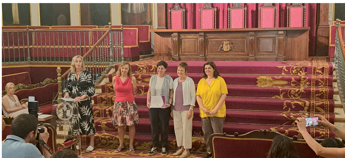
Fig. 3. Entrega del premio “Olga Quiñones” al mejor TFG con incorporación de la perspectiva de género y la igualdad.