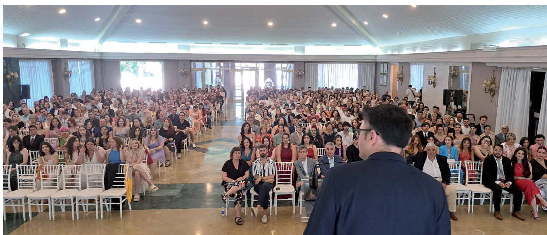
Fig. 1. Acto de graduación en Historia del Arte (promoción 2019-2023).