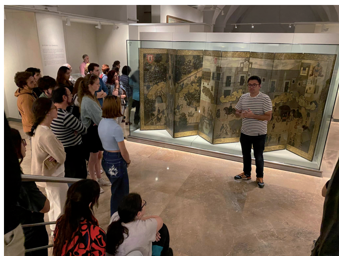
Fig. 6. Visita al Museo de América de alumnos de grado.

Nuestros alumnos realizan prácticas en museos públicos (Museo de Bellas Artes de València, Institut Valencià d'Art Modern-IVAM, Consorci de Museus de la Comunitat Valenciana, Museu de Belles Arts de Castelló, Museo Nacional de Cerámica González Martí, Casa Museu Benlliure, Museu d'Història de València, Museu Valencià de la Il·lustració i la