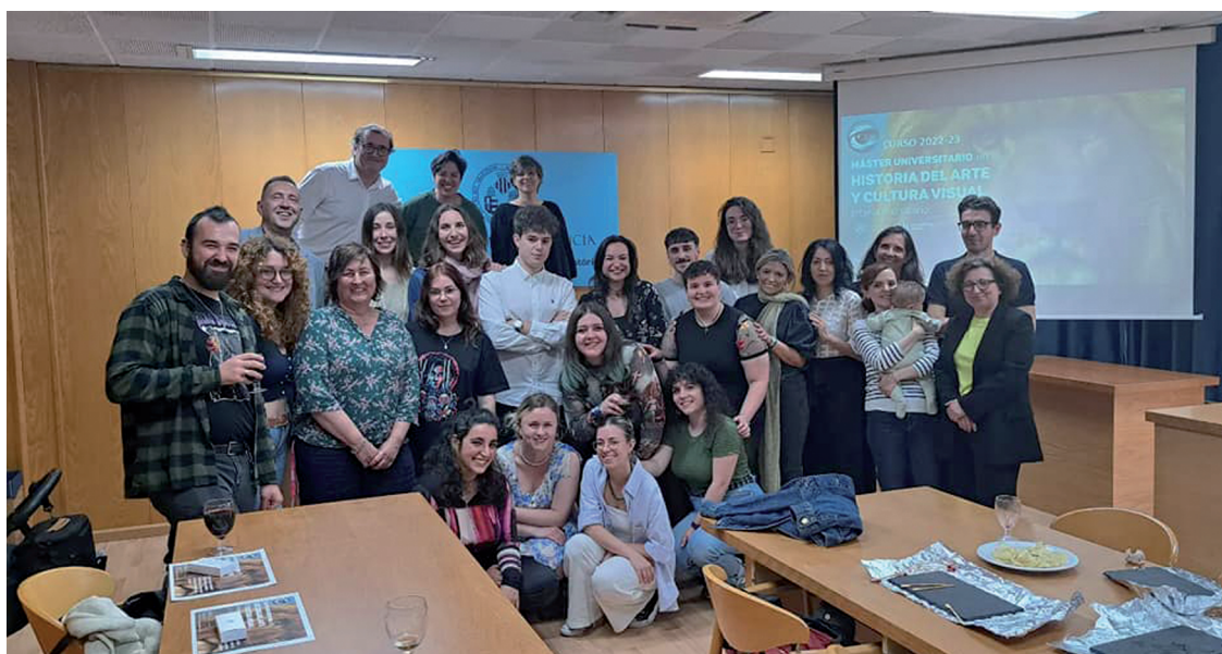
Fig. 7. Clausura del curso 2022-23 del Master de Historia del Arte y Cultura Visual.