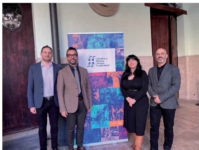
Fig. 10. Inauguración de la cátedra de Música i dansa tradicional de la Universitat de València.