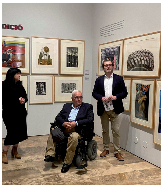
Fig. 8. Inauguración de la exposición "Estampes en transició. Obra gràfica de la Col·lecció Martínez Guerricabeitia".