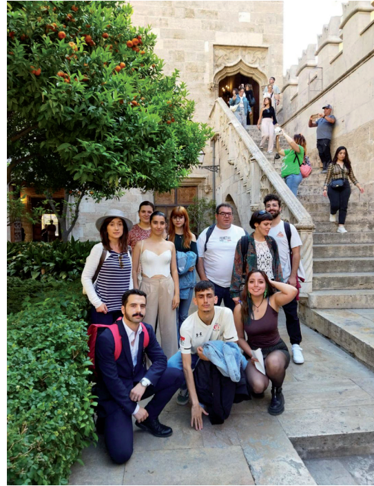
Fig. 5. Visita a la Lonja de alumnos de grado.

Los alumnos de la asignatura de Arquitectura Industrial visitaron el antiguo matadero municipal de Valencia que hoy acoge el Centro Cultural y Deportivo La Petxina y la antigua central hidroeléctrica de Nou Moles. En otra visita recorrieron un itinerario del patrimonio industrial de los barrios