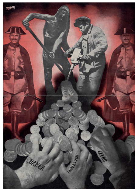
Séptimo mandamiento: No robarás