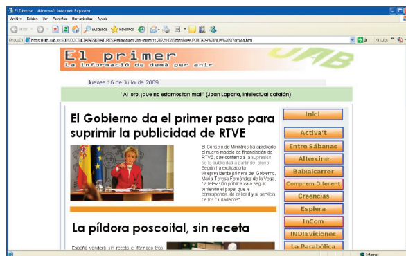
Figura 1: Reproducción de una de las portadas del ciberdiario

Asimismo, se apuesta por la utilización del Campus Virtual 1 para alojar allí artículos extraídos de publicaciones, tanto en papel como digitales, en los que se abordan temas de actualidad vinculados a la comunicación. Estos materiales tienen, por decirlo de alguna forma, una base muy profesional y no tan teórica como los que han podido leer en otras