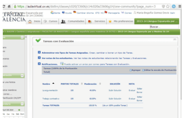
Figura 2. Ejemplo del módulo TAREAS. Curso 2013-14.

escrita del trabajo requiere que los alumnos demuestren tanto la consulta como el manejo adecuado de la norma lingüística y enfatiza la corrección (escrita y oral) en el ámbito académico.