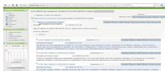
Figura 1. Ejemplo del módulo FORO: Diario de sesiones (curso 2012-13).

Cada uno de los grupos de trabajo está integrado por tres o cuatro estudiantes como máximo. Los alumnos se comprometen a hacer uso de las tutorías (proceso de comparación o contraste) y a considerar las indicaciones de los profesores. La elaboración