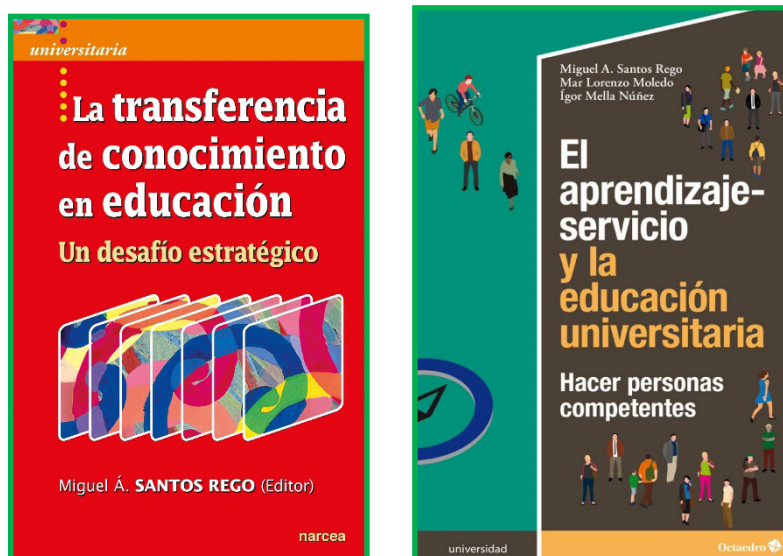
Fig.4. Selección de Publicaciones realizadas dentro del GI ESCULCA en 2020.