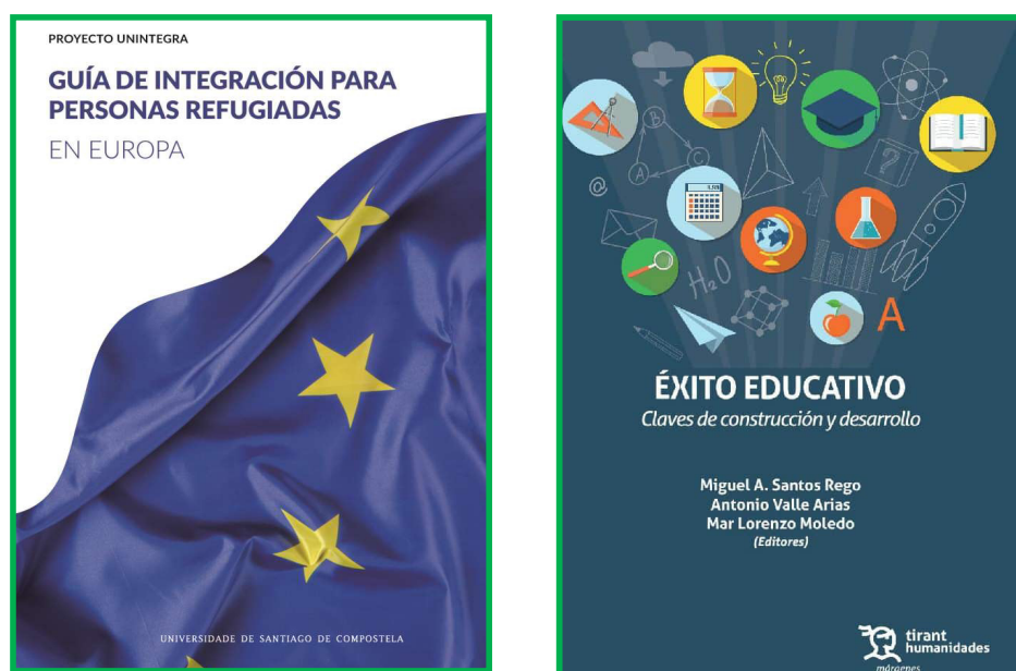
Fig.3. Selección de Publicaciones realizadas dentro del GI ESCULCA en 2019.