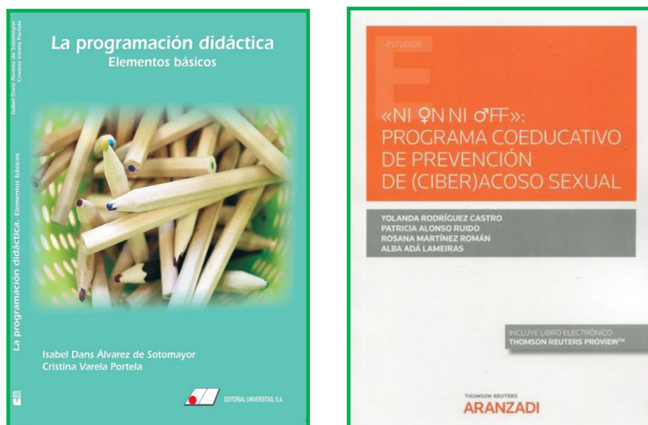
Fig. 6. Selección de Publicaciones de transferencia 2022 realizadas en el GI ESCULCA.