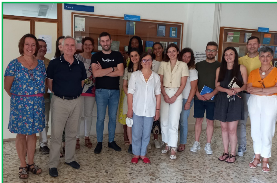
Fig. 7. Fotografía tras el Seminario GI ESCULCA. Facultad de Ciencias de la Educación, Universidade de Santiago de Compostela. 14 de julio de 2022.