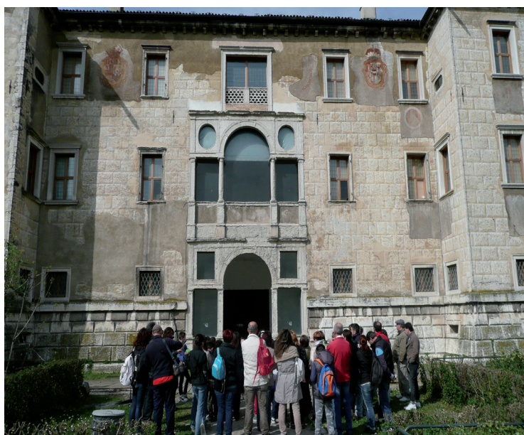
Proyecto “Formare al Patrimonio della Scuola” Scuola Primaria Statale Guglielmo Marconi, Rubiera (Reggio Emilia)

Un segundo elemento de reflexión es relativo a la necesidad de salvaguardar el sentido de la experiencia museística, cuyas actividades hacen referencia, no sólo al museo como institución individual, que realiza proyectos en secciones especiales dedicadas a la didáctica, pero también al museo entendido como paisaje cultural . Es, de hecho, a través de su abertura a lo social que el museo se define, volviéndose así “casa de cultura en diálogo con la ciudad”, en la perspectiva de un sistema formativo en red que, partiendo de un itinerario dentro de un específico museo, acompaña el visitante hacia otros museos, otros lugares de la cultura, que a su vez están en conjunción con agencias educativas del territorio, en particular en bibliotecas y archivos. La ciudad se configura así como el museo de los museos capaz de difundir un sentido de unión y responsabilidad al bien cultural de parte de todos los ciudadanos (Huerta, 2015), a partir de los niños. Esto significa trabajar dentro de una lógica sistémica a partir de acciones y a través de acciones que creen condiciones favorables para el diálogo por medio de actuaciones interinstitucionales.