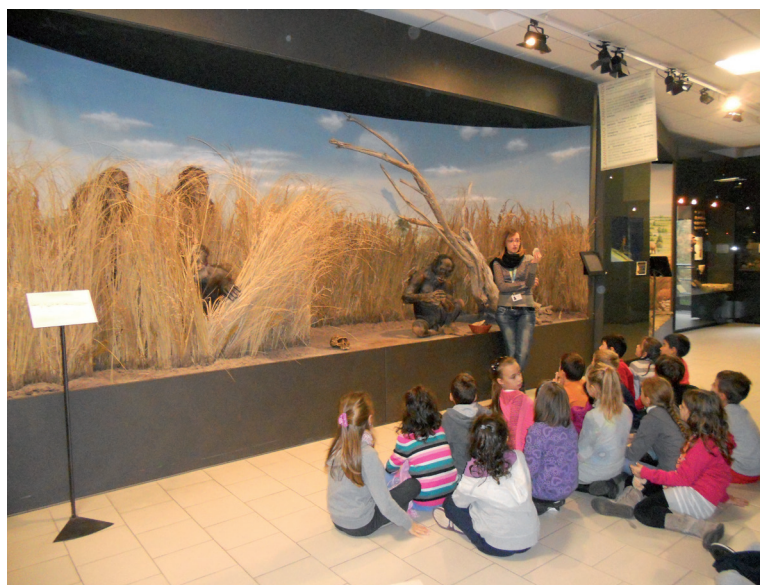
Proyecto “Formare al Patrimonio della Scuola” Istituto Comprensivo 12, Bologna

Consideraciones que también orientan el análisis de los contextos museísticos en el momento en que prometen la centralidad del visitante, es decir, de los públicos, considerados más ampliamente que los individuos a la hora de trasladar el saber de los objetos, de las obras, de los manantiales, pero también en tanto que inventores y constructores de conocimientos originales en relación al patrimonio. Dirigiéndose a todas las personas, el bien cultural y los lugares que lo interpretan tienen como destinatarios diferentes públicos: niños, jóvenes, adultos, ancianos, discapacitados, personas de otras culturas, turistas, además de grupos familiares, grupos de reintegración social y grupos profesionales en formación.