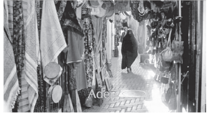
122. El zoco intercambiable: Tánger como Adén en Una película hablada .