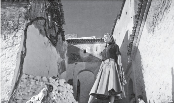
121. La corona negra . La ciudad como escenario onírico y de pesadilla