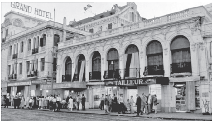
123. La Ciudad Internacional de El cielo protector .