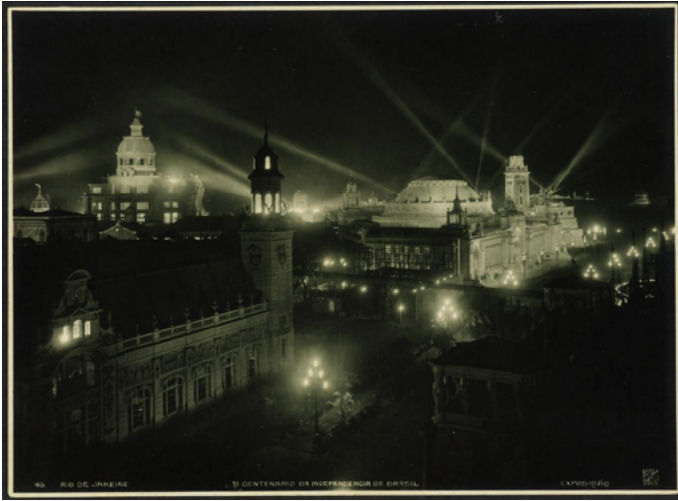
Figura 3. 1º Centenário da Independência do Brasil: Exposição. Cópia fotográfica de gelatina y plata, 16 x 22 cm. 1922-1923.

eugenésica que consistió en la eliminación de comunidades negras y sexualmente disidentes.