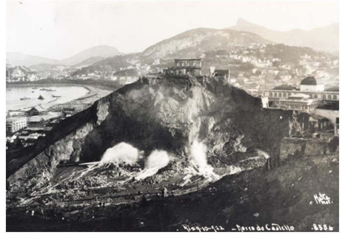
Figura 2. Malta, Augusto. Demolição do Morro do Castelo . Copia fotográfica de gelatina y plata, 16.8 x 23 cm, 1922.

El resto del Morro sobreviviría hasta 1920, cuando los oficiales municipales decidieron su destrucción completa, en el mismo año en que los periódicos cariocas publicaron las primeras noticias sobre un pequeño estafador llamado Febrônio, 5 precisamente el tipo de hombre que se aspiraba