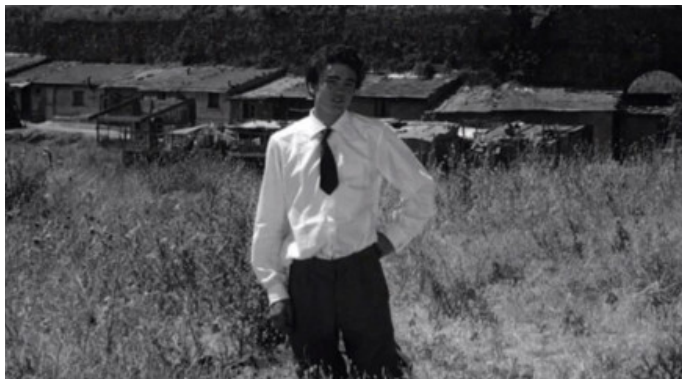
Mamma Roma, 1962

to, indifferente ai destini degli esseri umani. Descrivendo la scena in cui Ettore e sua madre arrivano al palazzo, Sartoni sottolinea che