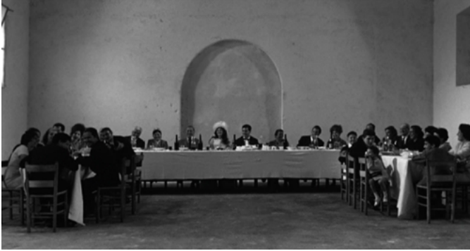
Mamma Roma, 1962