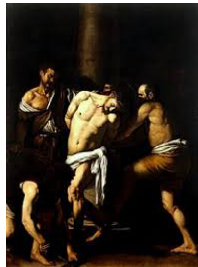
Luca Giordano, Flagellazione, 1660