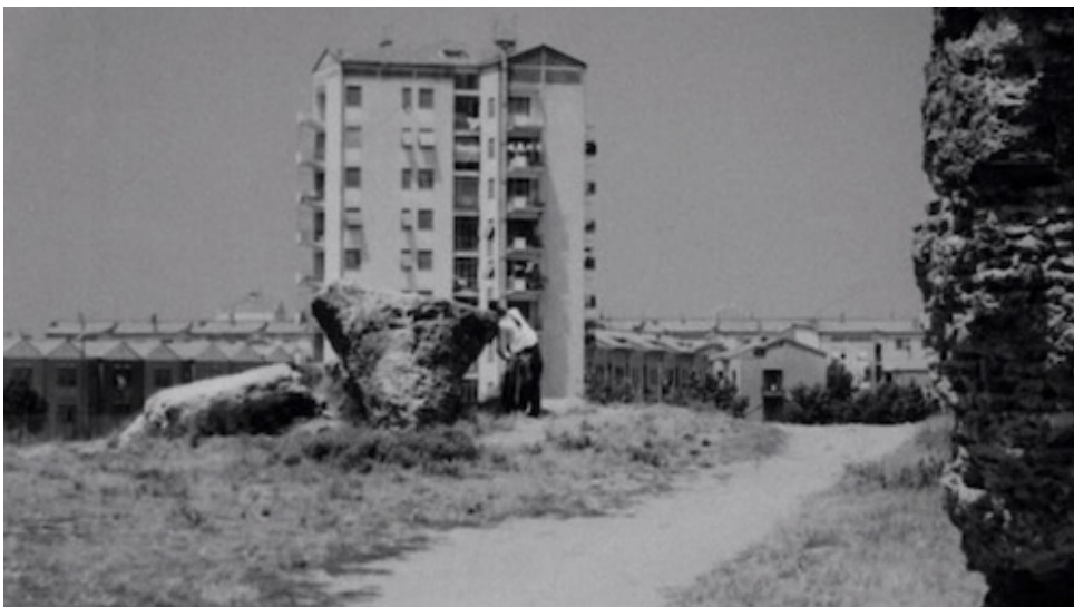
Mamma Roma, 1962

L'inevitabilità storica e sociale del martirio di Ettore-Cristo, anticipata nella scena in cui Ettore racconta a Bruna di come stava per morire da bambino, è sottolineata anche da Mamma Roma. Costretta a ritornare a prostituirsi da Carmine, durante una passeggiata notturna Mamma Roma, in un monologo denso di dolore e disillusione riassume l'inevitabilità del destino suo e di suo figlio in una litania comparabile alla genealogia di Cristo che si ritrova nel vangelo di Matteo 1,1-16 :