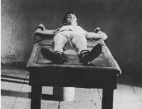
Mamma Roma, 1962