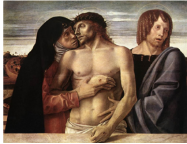
Giovanni Bellini, Pietà, 1465/70

clude con la deposizione. Anche questa ipotesi trova riscontro nella composizione dell'inquadratura che richiama la Pietà di Giovanni Bellini.