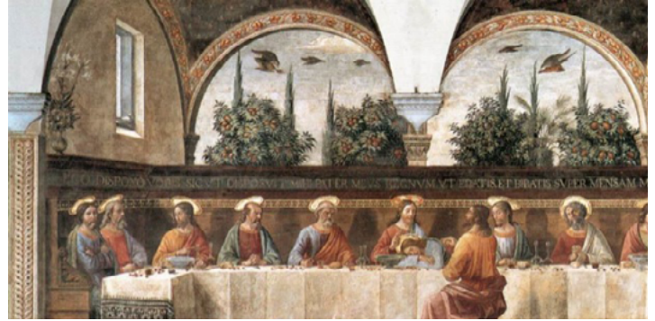
Ghirlandaio: Cenacolo di San Marco, 1480

Nei tre Vangeli sinottici, che costituiscono i testi utilizzati nella liturgia cattolica, la narrazione si apre infatti con l'Ultima cena e l'istituzione dell'Eucaristia e si conclude con la deposizione di Cristo.