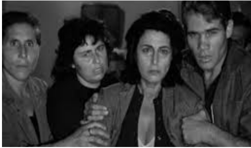
Mamma Roma, 1962