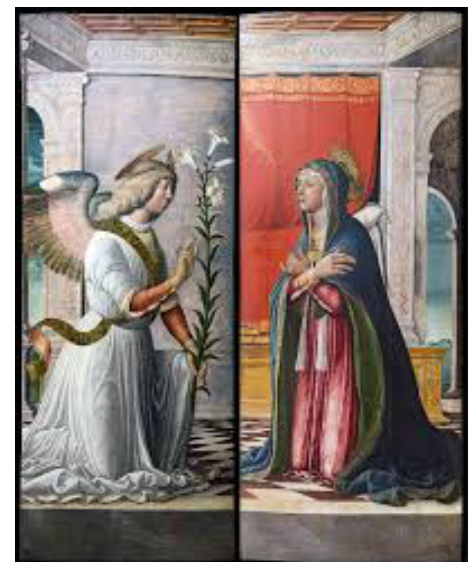
Luca Giordano, Flagellazione, 1660