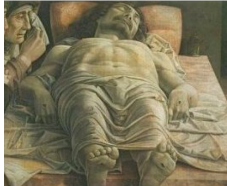
Mantegna, Cristo Morto, 1480 ca.

quadro è celebre soprattutto per la scelta del punto di vista che gli conferisce una prospettiva verticale che sembra evocare la classica prospettiva della crocifissione. Pasolini in realtà rifiutò questa associazione con Mantegna, appellandosi proprio al suo maestro Longhi e lamentando la superficialità dei critici: