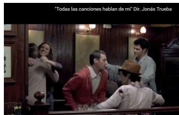
Figura 3 Escena de Todas las canciones hablan de mí (2010)

En la sociedad actual, el tratamiento normal que escucharíamos sería el tuteo. Este fragmento de Todas las canciones hablan de mí (2) transcurre en un bar, con gente de unos treinta años ( https://www.youtube.com/watch?v=N12ET9YOjFI ).