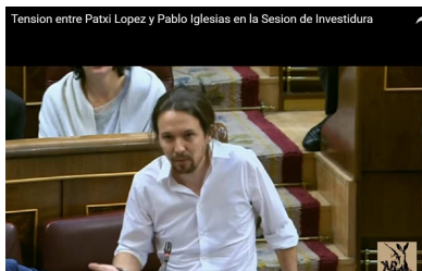
Figura 15. Pablo Iglesias en la sesión de investidura

Así pues, hemos visto que las formas de tratamiento pueden adoptar diversos valores en el discurso, y estos valores, como pone de manifiesto Blas Arroyo (2003), se hallan íntimamente determinados por las especificaciones contextuales de las situaciones comunicativas. En ocasiones, la misma actividad discursiva desempeña la acción contextualizadora. Es lo que ocurre en el siguiente diálogo que se desarrolla en las Cortes, en donde un diputado (Pablo Iglesias) se sorprende por la forma de tratamiento ( tú ) que le dirige el presidente del Congreso. La propia acción discursiva, ya contextualizada, hace que se vuelva al tratamiento de respeto (7). ( https://www.youtube.com/watch?v=V9ipGsInaRA )