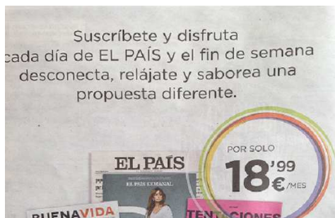
Figura 13. Anuncio de El País con tú

De igual modo, la actividad desarrollada es uno de los factores que más condiciona la elección pronominal. Si esa actividad conlleva diversión, ocio o relax (figura 13), lo adecuado es utilizar tú . Pero si es una actividad más seria que conlleva trabajo o estudio (figura 14), se optará por usted .