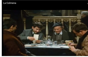
Figura 2. Escena de La colmena (1982)