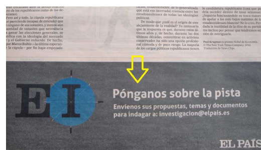
Figura 14. Anuncio de El País con usted