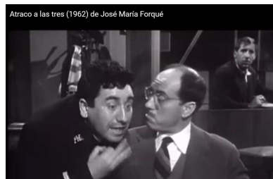
Figura 8. Escena de Atraco a las tres (1962)

Gran parte de los estudios sobre el tema que nos ocupa parten del trabajo pionero de Brown y Gillman (1960), para quienes el tratamiento pronominal gira en torno a dos tipos de relaciones. Unas, las relaciones de poder, son de naturaleza asimétrica y se caracterizan por el control que uno ejerce sobre el otro. En ellas, el hablante que ocupa la posición de poder se dirige con un tú al subordinado, que responde con usted (5). Lo podemos ver en esta escena de Atraco a las tres , en donde el chófer emplea el usted y recibe tú de su superior jerárquico ( https://www.youtube.com/watch?v=K-qz0ccZ9Ho ).