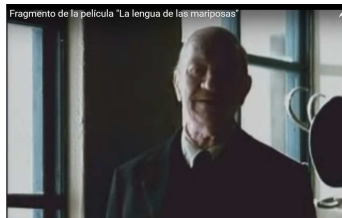
Figura 4. Escena de La lengua de las mariposas (1999)

( https://www.youtube.com/watch?v=SO3U3TyqYrY )