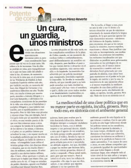
Figura 1. Artículo Un cura, un guardia, unos ministros (2013)

En efecto, el hecho de que, como veremos después, el tuteo se haya generalizado bastante en nuestra sociedad, no quiere decir que podamos utilizarlo en cualquier situación. Como ejemplo, mostramos esta anécdota que se relata en un artículo de Arturo Pérez Reverte ( XL Semanal , 26 de mayo de 2013). El escritor, que acaba de cometer una infracción de tráfico, es recriminado por un guardia, que se dirige a él de forma poco educada: ¿Qué pasa? ¿No has visto el semáforo o qué? , le increpa el policía, a lo que el escritor y periodista responde: Tiene usted razón, pero ¿por qué me tutea? Acto seguido, según sigue contando Pérez Reverte en su artículo, el agente pasa al usted de inmediato, y tiene los reflejos de responder No oigo lo que me dice, señor y le ordena que siga adelante y no se quede en ese lugar.