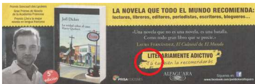
Figura 12. Anuncio de una novela

Sin embargo, una novela actual, dirigida a un público popular, requiere más cercanía, por lo que se ha optado por el tuteo (figura 12).