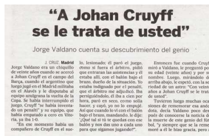
Figura 10. Noticia de El País