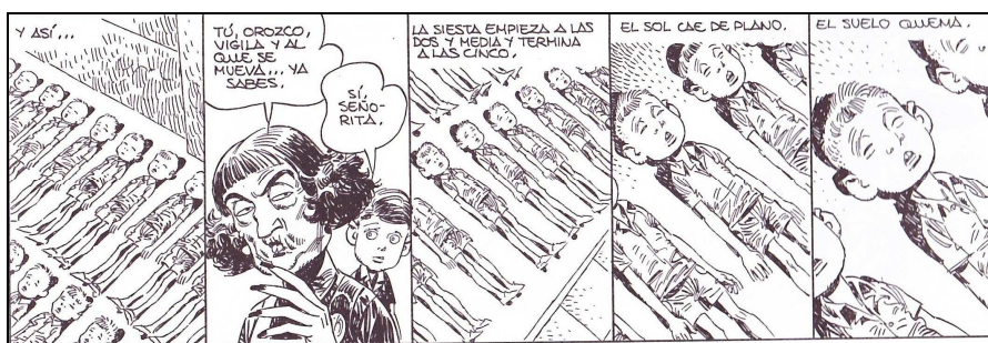
Figura 6. Viñetas de Paracuellos (Giménez, 2012: 57)

Como actividad se propone distribuir diferentes tiras de Paracuellos . Dependiendo de la cantidad de estudiantes puede plantearse como una actividad grupal o individual. Se les solicitará analizar las viñetas y escribir un relato descriptivo de lo que ven en las mismas, que posteriormente será corregido en sus aspectos léxicos y gramaticales por el profesor. Para finalizar, y a modo de refuerzo de la expresión oral, los estudiantes leerán los relatos al resto de sus compañeros.