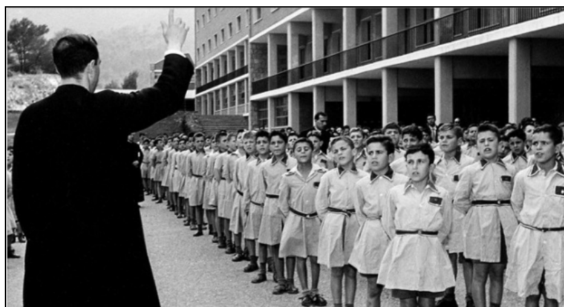
Figura 3. Foto de archivo que retrata a los niños del Auxilio Social. Disponible en la web de la Asociación para la Recuperación de la Memoria Histórica: http://memoriahistorica.org.es/tag/auxilio-social/ [Consulta: 20/04/2016]

En esta práctica se partirá de la visualización de fotos del Auxilio Social, para llegar a una actividad de interpretación y asociación. Se trabajará en el desarrollo de destrezas orales a partir de la propuesta de Freire de una pedagogía de la pregunta, ya abordada en la actividad 1.