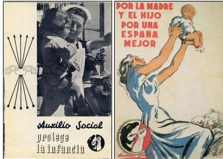
Figuras 4 y 5. Carteles del Auxilio Social. Disponibles en http://centros1.pntic.mec.es/ies.maria.moliner3/guerra/pages/ncartel10_jpg.htm y en http://www.femicidio.net/articulo/las-mujeres-que-se-querellan-contra-el-franquismo [Consultas: 21/04/2016]

Como estrategia de comprensión, además de los formatos digitales, es beneficioso introducir formatos tradicionales. Aún se consiguen en los rastros revistas publicadas durante el franquismo, por lo que, se recomienda conseguir una o dos y llevarlas a clase. Para los estudiantes, por un lado, resulta llamativo el contraste, por otro lado, será novedoso tocar y oler el papel. Esta práctica les proporcionará un mayor acercamiento al clima de la época.