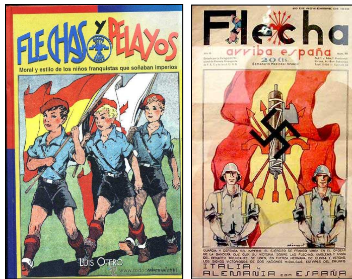
Figuras 7 y 8. Portadas de la revista Flechas y Pelayos . Disponible en Martín (2008)

detalle las diferencias entre los hijos de los vencidos (destinados a una reeducación ideológica y religiosa, alejados de sus familias) y los hijos de los vencedores.