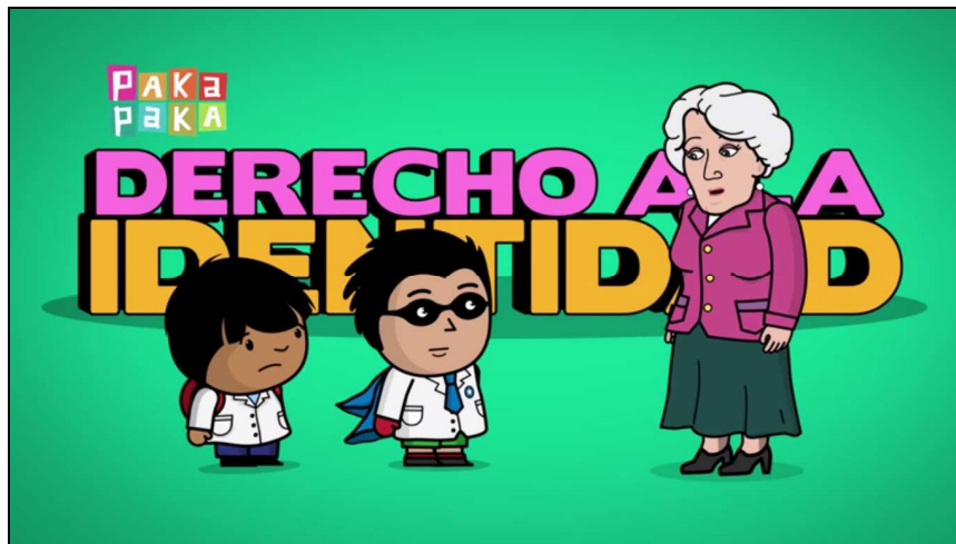
Figura 1. Presentación del capítulo de «El asombroso mundo de Zamba» dedicado a la identidad. Disponible en https://www.abuelas.org.ar/noticia-difusion/zamba-y-el-derecho-a-la-identidad-14 [Consulta: 20/04/2016]

Luego de discutir conjuntamente sobre el concepto de identidad se visualizará el video animado Zamba pregunta ¿Qué es la identidad? 1