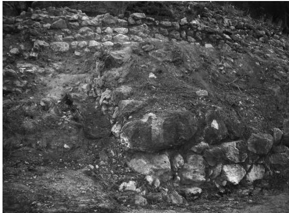
Fig. 3. En primer término, la Torre 1. Detrás y más arriba, la Muralla UE-7127.

queda colgado parte de un muro ibérico, al que no hay asociado pavimento alguno.