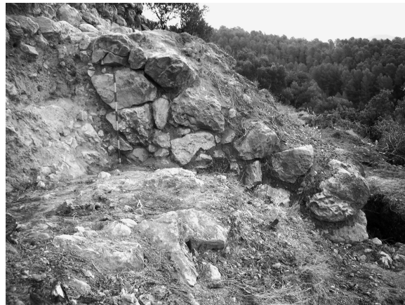
Fig. 2. Torre 1. lado W.

Nos encontramos ante una estructura defensiva formada por al menos una gran torre y quizás una segunda, de planta rectangular, que se adosa a una muralla descubierta en más de 10 m de longitud, de la que aún sabemos poco,