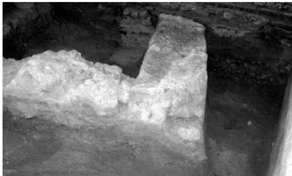
Fig. 3. Castillo de Buñol. Restos del primer recinto encontrados bajo el suelo del palacio señorial (El Oscurico). (Fotografía E. Díes).

Los dos modelos de almenas hallados se han conservado porque en este caso no se demolieron, sino que fueron cubiertos mediante muros modernos, quedando así protegidos durante siglos. En la muralla norte las almenas son paralelepípedos sencillos de unos 90 cm de alto por 60 cm de ancho y 40 cm de espesor, realizados en mampostería y revestidos con argamasa. De este tipo ya se había encontrado un par en la restauración de la torre NE. Por el contrario, las del lado oeste son mucho más elaboradas, como puede comprobarse en la fotografía, ya que la parte superior tiene una forma piramidal sobre alero de ladrillo, alcanzando así una altura de 1'20 m sobre el parapeto, lo que daba al soldado una protección total de más de dos metros (Fig. 2).