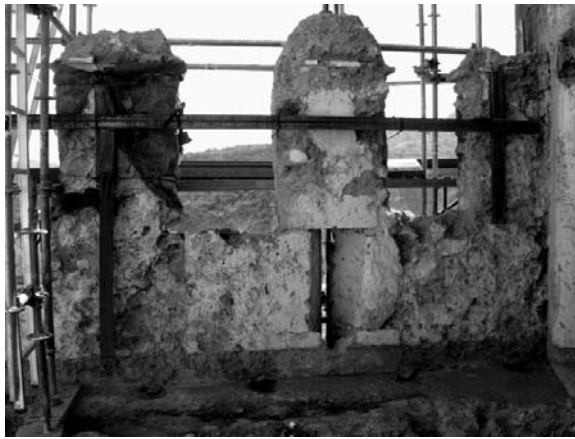
Fig. 2. Castillo de Buñol. Almenas originales conservadas en la fachada oeste.