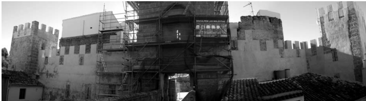
Fig. 5. Castillo de Buñol. Fachada norte restaurada (2008-2009).

santes sobre la evolución constructiva de este edificio, datado posiblemente a comienzos del siglo XIV.