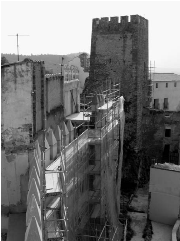
Fig. 4. Castillo de Buñol. Fachada oeste restaurada (2008-2009).

Posteriormente, en el s. xv, los nuevos señores, los Mercader, realizaron una mayor nivelación ahora a una cota de -1 m.