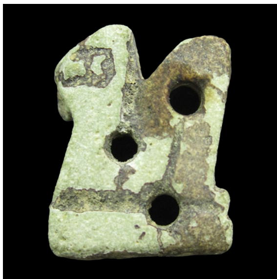
Fig. 11. Cobra-uraeus (S.I.P. nº 4.896).