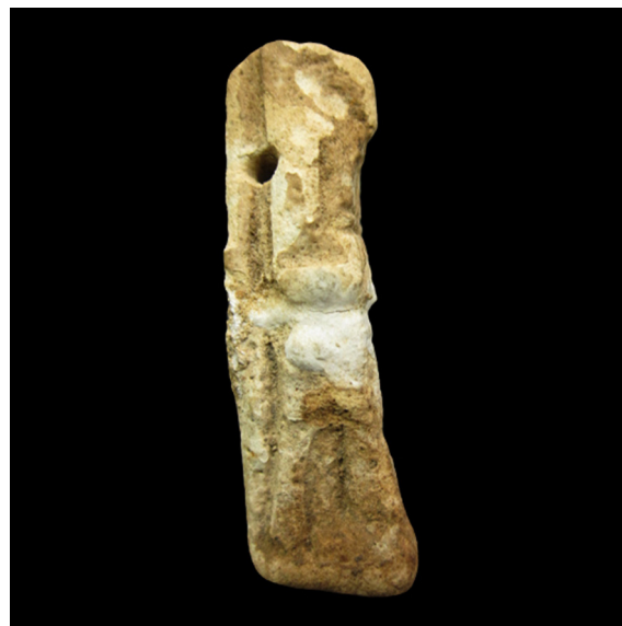
Fig. 4. Divinidad antropomorfa con cabeza de carnero (S.I.P. nº 4.884).

amuleto como posible enano pateco basándose en la publicación de Gamer-Wallert, aunque conociendo la identificación correcta, este amuleto tendría que estar en el apartado de enanos patecos panteos.