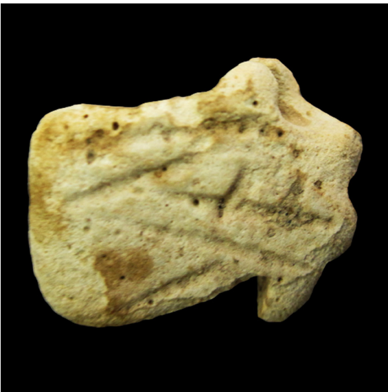
Fig. 8. Ojo-udjat (S.I.P. n° 4.899).