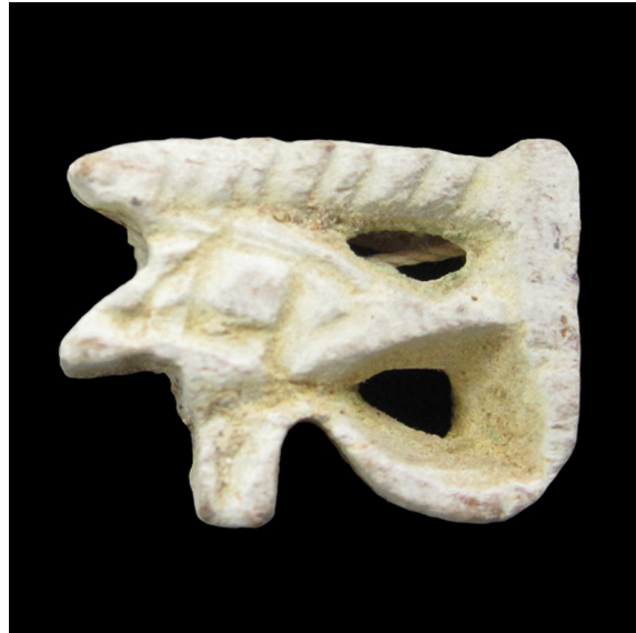
Fig. 9. Ojo-udjat (S.I.P. n° 4.900).