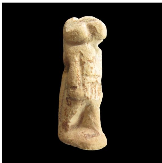
Fig. 5. Divinidad antropomorfa con cabeza de carnero (S.I.P. nº 4.891).