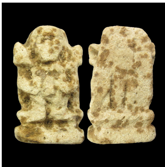
Fig. 1. Enano pateco panteo (S.I.P. n° 4.893).

La información que Gamer-Wallert ofrece del amuleto V6 apunta a un posible pateco pequeño muy desgastado engarzado en un collar, que está hecho con fayenza egipcia, que pertenece a la colección Pérez Cabrero, que está inédito –al menos en cuanto a su publicación individualizada– y que su estudio se basa en una fotografía proporcionada por D. Fletcher Valls (Gamer-Wallert 1978: 310, V6).