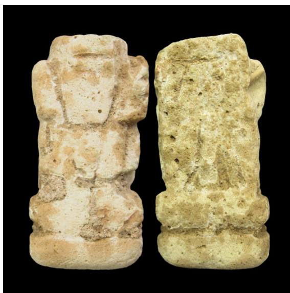
Fig. 2. Enano pateco panteo (S.I.P. n° 4.894).

La única pieza que concuerda con estos datos es la S.I.P. n° 24.211: un enano pateco panteo muy deteriorado que forma parte del collar S.I.P. n° 4.785 –de composición moderna–; hay dos collares montados en las mismas circunstancias: el S.I.P. n° 4.563 y otro cuya única referencia es que está montado en la terracota con sigla M.M.2. No obstante, en ninguno de ellos puede verse un amuleto representando un enano pateco. Fernández y Padró (1986: 91) colocan este