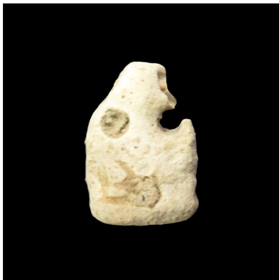
Fig. 3. Enano pateco panteo (S.I.P. nº 24.211).