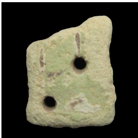
Fig. 12. Cobra-uraeus (S.I.P. nº 4.897).