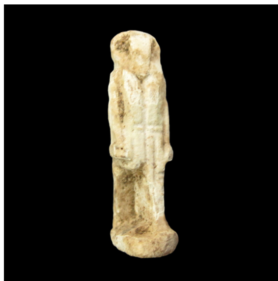
Fig. 6. Divinidad antropomorfa con cabeza de carnero (S.I.P. nº 4.892).

los amuletos de tipo egipcio, que deben su nombre a este hecho. Encontramos seis tipos de cabezas zoomorfas en estos objetos: carnero, ibis, halcón, león, mono y chacal. El primero es el único animal representado en el conjunto estudiado, y se han podido identificar tres ejemplares. El carnero es el animal representativo de importantes deidades egipcias como son el poderoso Amón-Ra, o el demiurgo creador del ser humano en su torno de alfarero, Jnum. Las imágenes con cabeza de carnero no pueden ser adscritas a una divinidad concreta según las informaciones disponibles y tienen una profusión bastante discreta dentro del repertorio de amuletos de tipo egipcio. En su apariencia, estas representaciones emulan la estatuaria regia egipcia, como también lo hacen el resto de imágenes antropomorfas con cabeza animal: se muestra un personaje de pie con una pierna avanzada, los brazos estirados pegados al cuerpo y los puños cerrados, y portando un faldellín como único atuendo.