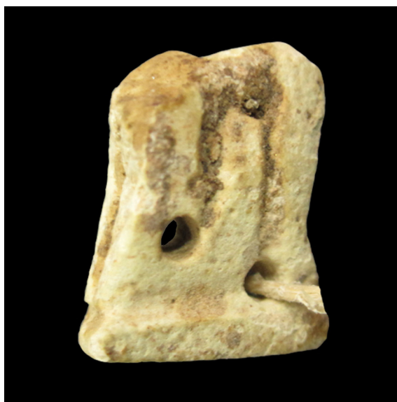
Fig. 10. Cobra-uraeus (S.I.P. nº 4.895).

Tres cobras han sido identificadas en el repertorio estudiado, aunque Gamer-Wallert (1978: 310, V8) sólo hace referencia a una aufgerichtete Kobra, mit hoher Windung des Leibes. In Kette . Esta descripción sólo puede hacer referencia a la S.I.P. nº 4.895, la única engarzada en un collar (S.I.P. nº 4785).