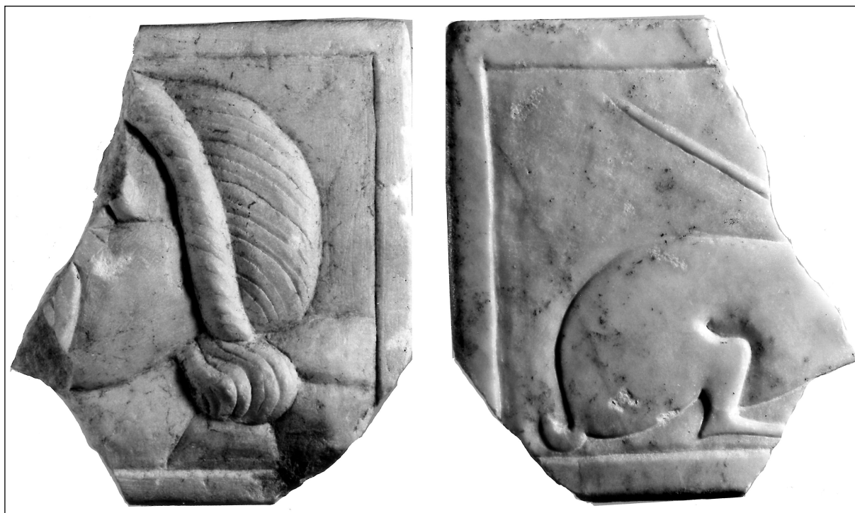
Fig. 2. Fotografies de les dues cares de l' oscillum de Lliria.

Es tracta d'una placa de forma rectangular de marbre blanc de gra fi amb fines vetes grisenques, trencada de manera irregular aproximadament per la seua meitat, a la qual li falta l'angle inferior (fig. 2). Només en conserva l'alçària, que és de 16,1 cm; l'amplària màxima conservada és de 13,5 cm; la seua grossària mínima és de 2,3 cm i la màxima de 3,3 cm (fig. 3). Com és habitual en aquest tipus de peces, presenta per ambdues cares -sobre fons llis- una decoració en baixrelleu que sobresurt un màxim d'1 cm, emmarcada per un llistell incís que dibuixa un marge també llis un poc irregular d'1,2-1,3 cm d'ample. La seua superfície està ben polida, però conserva fines línies de treball gravades. Les fractures són velles, excepte alguns petits esvoralls.