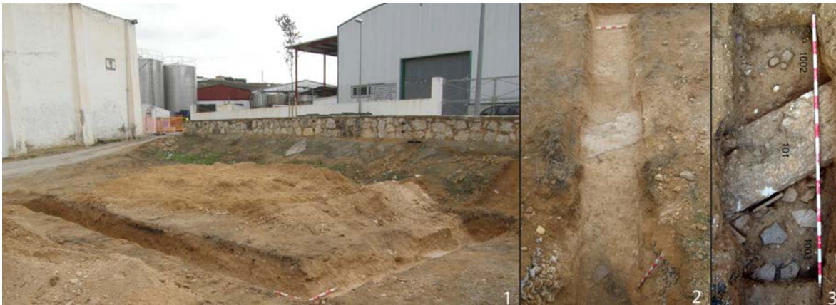
Fig. 4. Zanjias realizadas con método arqueológico en la Zona 1.