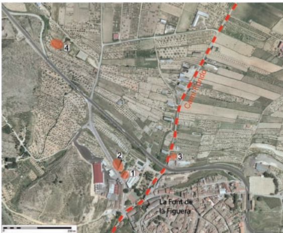
Fig. 5. Restos arqueológicos de época romana citados en el texto sobre ortofoto del Institut Cartogràfic Valencià: 1: Ermita de Sant Sebastià; 2: Restos junto al frontón del polideportivo; 3: Inhumaciones; 4: Balsa de Zele.

de manifiesto la reciente excavación realizada y presentada en las jornadas sobre calzadas romanas en Auritz-Burguete (Navarra).