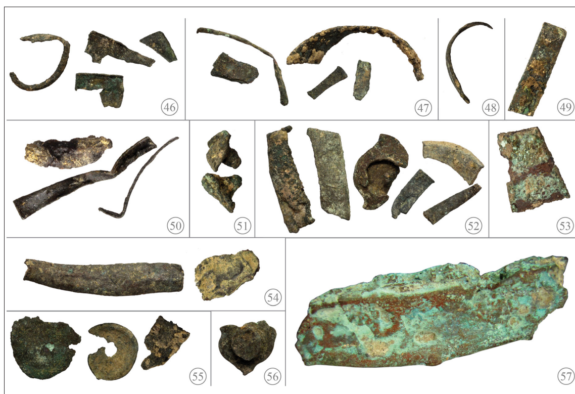
Fig. 5. Cueva de la Torre del Mal Paso: rielees (46-50) y objetos varios (51-57). La numeración de las imágenes hace referencia a las entradas del catálogo.

En la provincia actual de Valencia se conocen numerosas cuevas donde se falsificó moneda, como la Cova de l'Àguila (Ripollès 1993), la Cueva de la Soterraña de Chella (Mateu y Llopis 1954) o la Cova de l'Aigua de Simat (Toledo 1979), entre otras. En zonas cercanas al Mal Paso, además de los restos del Monte Zamora ya citados, se documenta el excepcional hallazgo de las tijeras de la Cueva de la Soterraña, al servicio de un taller de falsificación de moneda castellana (Mateu y Llopis 1954).