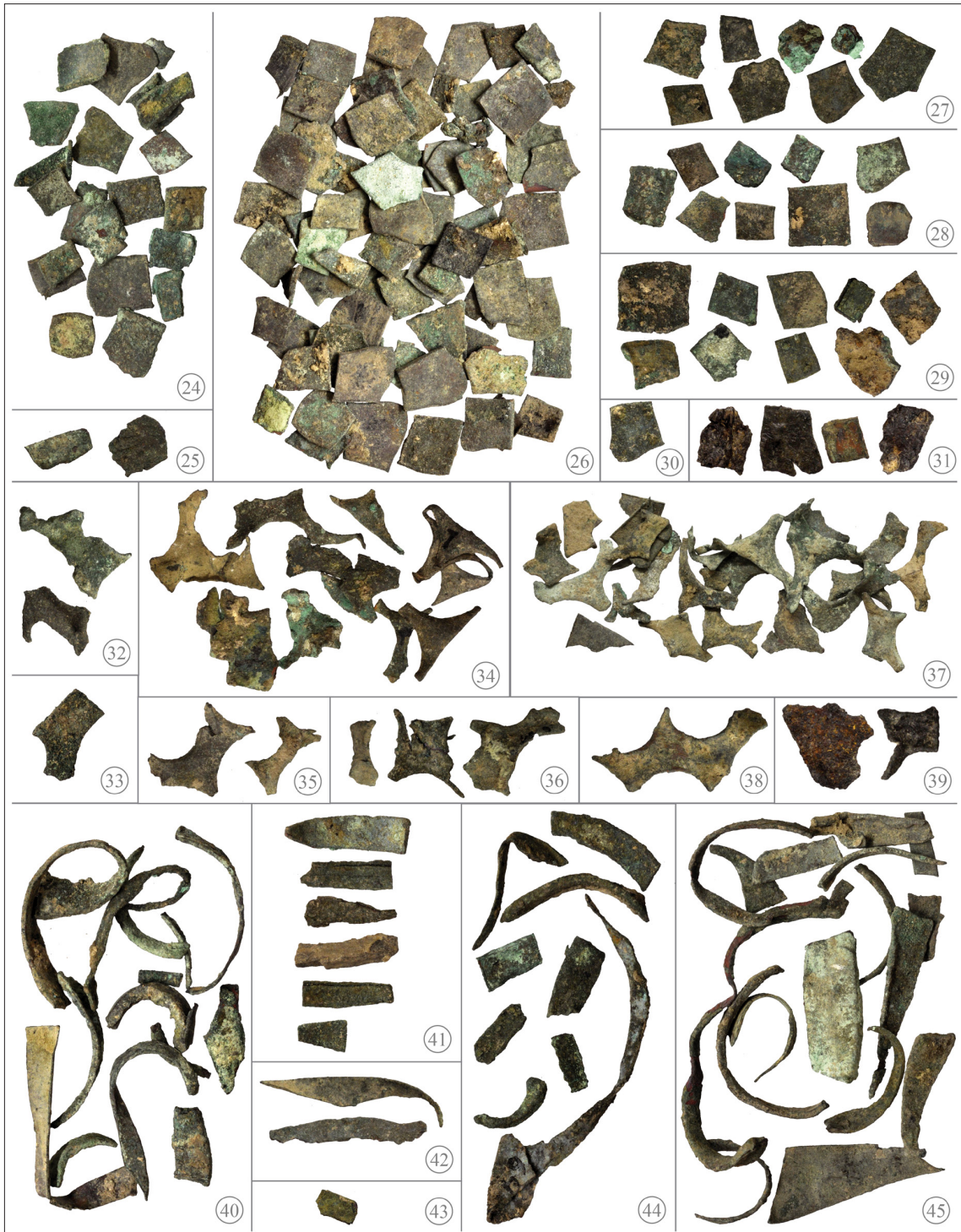
Fig. 4. Cueva de la Torre del Mal Paso: recortes (24-39) y rieles (40-45). La numeración de las imágenes hace referencia a las entradas del catálogo.