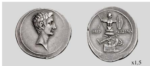
Fig. 12. Denario de Octaviano. Brundisium o Roma. RIC I 2 265a. 3,57 g. Numismatica Ars Classica NAC AG 06/04/2006 lote 393.

Son varias las emisiones que se han relacionado con la batalla de Naulochus , algunas parecen bastante evidentes; tal es el caso del áureo RIC I 2 273 (fig. 11), con Diana en el anverso, y un trofeo naval dentro de un templo con un trisquel en el tímpano en el reverso. La advocación de la diosa Diana como Siciliensis parece clara en esta moneda en la que se asocia con el trisquel –símbolo siciliota por excelencia– del reverso. Del mismo modo que Apolo fue el protector de Actium , como se muestra en las monedas acuñadas en Lugdunum c. 15-13 a.C. en conmemoración de la batalla ( RIC I 2 170-171), Diana aparece representada como diosa protectora de la batalla de Naulochus en áureos y denarios de este mismo momento ( RIC I 2 172-173).