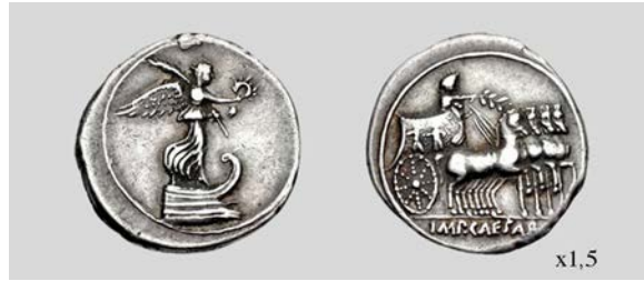
Fig. 20. Denario de Octaviano. Brundisium o Roma. RIC I 264 3,81 g 12 h. Classical Numismatic Group, Inc. 03/01/2011 lote 611.

apuntado siguiendo tal vez a Richter (1889: 154) o a Gurval (1995: 41) que tras la batalla de Naulochus también fue decretada la erección de un monumento similar (Dio Cass. 49, 15, 1). Sin embargo, este arco anterior es descrito como coronado por trofeos, no correspondiendo en ningún caso con la representación del arco de nuestra emisión. Para la discusión acerca de los arcos de triunfo dedicados a Augusto en el Foro Romano cfr. Gurval (1995: 40 y ss.), Richter (1889), Holland (1946) y Scott (2000).