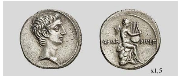
Fig. 14. Denario de Octaviano. Brundisium o Roma. RIC I 2 257 3,79 g. Áureo & Calicó 20/03/2014 lote 1120.

A diferencia de las emisiones que acabamos de comentar, existen otras cuyos tipos no presentan suficientes rasgos definitorios para poder adscribir las con seguridad a un hecho particular, si es que en su origen estuvieron pensadas con esa mentalidad. Prueba de todo ello es la emisión de denarios RIC I 2 257 (fig. 14) que muestra en el reverso a Mercurio con el petaso, una lira y cuyas talaria pueden apreciarse en los ejemplares mejor conservados. En la actualidad ya está aceptada de forma unánime esta interpretación que en el pasado suscitó tanta controversia. Sydenham (1920: 33) y Mattingly (1923: cxxiii) ya lo identificaron con Mercurio mientras que Kraft 1969: 14-18 defendió que se trataba de Apolo Leucadius . Por su parte Sutherland (1976: 150) vio a Apolo Actius , aunque al parecer sin mucha seguridad puesto que en la página 133 dudaba de su adscripción y en su tabla de cuños identificaba el reverso como Mercury on rock . Quienes dudaron de la iconografía de Mercurio lo hicieron por la aparición de la lira, olvidando que Apolo la tañía pero Mercurio fue su inventor.