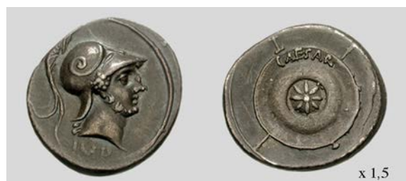
Fig. 3. Denario de Octaviano, Brundisium o Roma. RIC I 2 274 3,92 g 3 h.

Volviendo al grupo de emisiones que vamos a tratar, es destacable que su falta de especificidad plantee a priori complicaciones en cuanto a su adscripción cronológica concreta. En los catálogos monetales del s. XIX como el de Cohen, a estas emisiones se les atribuía un periodo cronológico más bien laxo de entre el 35 y el 28 a.C. (Cohen 1880: 71-74). Sin embargo, ya en el s. XX, los tipos iconográficos de las monedas hicieron que Mattingly (1923: cxx y ss.) las asociara por primera vez con el momento inmediatamente posterior a la batalla de Actium , aduciendo una cronología para ellas que iba desde el 31 a.C. al 27 a.C. Proponía además Mattingly una diferenciación cronológica entre las monedas con leyenda CAESAR DIVI F, que fechó entre el 31-29 a.C. y las que portaban IMP CAESAR, adscritas al periodo posterior, 29-27 a.C. y situaba la acuñación de ambas series en las cecas de Éfeso y Pérgamo. Posteriormente Kraft (1969) estudió de manera profunda –aunque demasiado