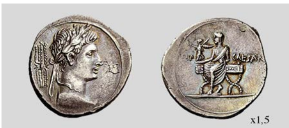
Fig. 25. Denario de Octaviano. Brundisium o Roma. RIC I 2 270 3,73 g. Numismatica Ars Classica NAC AG 05/03/2009 lote 139.

Tras la finalización de los homenajes triunfales, Octaviano debía cumplir la promesa que ya estaba presente desde el 36 a.C. de devolver la paz y restaurar la res publica . La conjunción de estos actos y la idealización del nuevo gran dominio de Roma parece estar representado en las emisiones RIC I 2 269-270. La primera de ellas