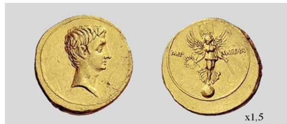
Fig. 23. Áureo de Octaviano. Brundisium o Roma. RIC I 2 268 7,8 g. Numismatica Ars Classica NAC AG 07/01/2009 lote 303.

Por otra parte, la emisión áurea RIC I 2 268 (fig. 23) presenta una Victoria sobre un globo con las alas extendidas, portando una corona en la mano derecha y un vexillum en la izquierda. Si comparamos esta Victoria con la que se ve en la parte superior de la emisión RIC I 2 266 ( Curia Iulia ) podemos observar, como han hecho otros autores (Zanker 1987: 104; Gurval 1995: 62) que se trata de la misma representación, por lo que la imagen de la emisión RIC I 2 268 debe ser la única que conservamos de la Victoria de Tarento colocada en la Curia Iulia por orden de Octaviano. En contra de esta opinión, Gurval, leyendo a Dion Casio, concluyó que no debía insistirse tanto en esta opinión teniendo en cuenta que esta representación carecía de los adornos del botín de guerra mencionados en las fuentes escritas (Gurval 1995: 62).