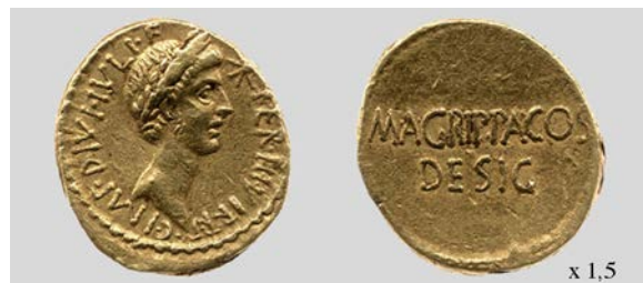
Fig. 4. Áureo de Octaviano. Ceca móvil. RRC 534/1 8,23 g 1 h. The British Museum, BM R.9428.

Para las monedas con leyenda CAESAR DIVI F, Sutherland propuso una cronología de c. 32-29 a.C. por haber sido utilizadas para pagar a sus tropas antes y después de la batalla de Actium –interpretándolas como emisiones de guerra ( war-coinage ) (Sutherland 1976: 143)– y considerando su fecha de inicio en el 32 a.C. por la desaparición de la leyenda triunviral a consecuencia de la finalización del triunvirato el 31 de diciembre del 33 a.C. Este planteamiento ha sido criticado por la existencia de varias emisiones monetales anteriores al 33 a.C. que no llevan leyenda triunviral alguna (RRC 534/2-3, 535) (Assenmaker 2007: 164 nota 19). Posteriormente (c. 29-27 a.C.) según Sutherland, debió acuñarse la masa monetaria que porta la leyenda IMP CAESAR, precisamente por el uso del praenomen IMP(erator) al que atribuía una datación post quem del 29 a.C. momento en el que, según Dion Casio (52, 41, 3-4), lo recibió de iure . Esta distinción de dos grupos de emisión fue criticada posteriormente por Rich y Williams para quienes la fecha de Dion Casio no debió ser más que un error. Ya fuera realmente un error o el reconocimiento oficial de un título que Octaviano ya tenía de facto , la evidencia numismática muestra que Octaviano había empleado el praenomen IMP(erator) en otras emisiones desde el 38 a.C. (RRC 534/1, 534/3, 537-8, 540) (fig. 4) (Rich y Williams 1999: 172 nota 7), quedando desautorizado el argumento de Sutherland en la bibliografía posterior (Assenmaker