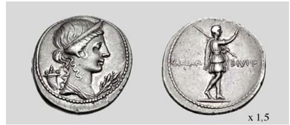
Fig. 8. Denario de Octaviano. Anv. Busto de Pax. Rev. Fig. de Octaviano. Brundisium o Roma. RIC I 2 253 3,72 g 2 h. Classical Numismatic Group, Inc. 06/01/2014 lote 605.