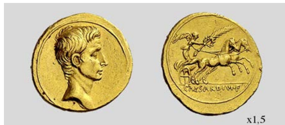
Fig. 16. Áureo de Octaviano. Brundisium o Roma. RIC I 2 260 7,71 g. Numismatica Ars Classica NAC AG 05/03/2009 lote 133.

Finalmente y en referencia a las victorias de Naulochus y Actium existen tres emisiones ( RIC I 2 260, 261, 272) cuya adscripción a una u otra victoria se plantea prácticamente imposible. Las dos primeras ( RIC I 2 260, 261) (fig. 16, sólo RIC I 2 260) muestran un tipo similar; se trata de una Victoria alada con palma sobre una biga rápida, en clara alusión a una victoria militar de Octaviano. Sin embargo, la falta de argumentos a favor o en contra alguna de las dos batallas hace que no podamos determinar un arco cronológico más allá del genérico ( vid. supra ) para estas dos emisiones áureas.