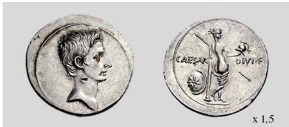
Fig. 6. Denario de Octaviano. Anv. Cab. de Octaviano. Rev. Fig. de Venus. Brundisium o Roma. RIC I 2 250a 3,84 g 1h. Classical Numismatic Group, Inc. 07/01/2008 lote 638.