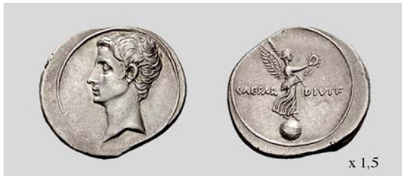
Fig. 7. Denario de Octaviano. Anv. Cab. de Octaviano. Rev. Fig. de Victoria. Brundisium o Roma. RIC I 2 255 3,88 g. Numismatica Ars Classica NAC AG 11/05/2005 lote 430.