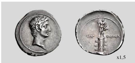
Fig. 13. Denario de Octaviano. Brundisium o Roma. RIC I 2 271 3,71 g 7 h. Classical Numismatic Group, Inc. 14/05/2014 lote 735.

También podemos incluir en este grupo la emisión RIC I 2 271 (fig. 13), que muestra una columna rostrata , adornada con las proas de nave y anclas – rostra et anchorae – de los barcos del enemigo vencido en Naulochus . Sobre la columna se encuentra una estatua desnuda, identificada como Octaviano, con una capa al hombro, lanza y parazonium . Apiano menciona la ovatio que recibió Octaviano junto con la erección de la estatua dorada sobre la columna rostrata en el Foro con una inscripción τὴν εἰρήνην ἐστασιασμένην ἐκ πολλοῦ συνέστησε κατὰ τε γῆν καὶ θάλασσαν (Restableció la paz, interrumpida durante largo tiempo, en la tierra y en el mar) (Apiano Bell. Civ. 5,13,130). El anverso de esta emisión es singular por ser el único de entre todas las que estamos tratando en el que la cabeza de Octaviano aparece laureada, en correspondencia directa con la imagen triunfal del reverso (Gurval 1995: 58). Por otro lado, pero en el mismo sentido, Zanker (1987: 64) relaciona la corona con otro honor concedido a Octaviano por el Senado tras la celebración de la ovatio del año 36 a.C: llevar la corona de laurel en cualquier ocasión (Dio Cass. 49,15,1) haciendo que podamos adscribir sin duda esta emisión entre las que conmemoraron la victoria sobre Sexto Pompeyo con anterioridad al 31 a.C.