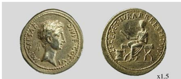
Fig. 26. Áureo de Octaviano. Ceca indeterminada de Asia Menor. Inédito en RIC 7,95 g. The British Museum, BM CM 1995.4-1.1.