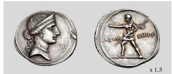
Fig. 9. Denario de Octaviano. Anv. Busto de Venus. Rev. Fig. de Octaviano. Brundisium o Roma. RIC I 2 251 3,82 g 12 h. Classical Numismatic Group, Inc. 07/01/2013 lote 985.