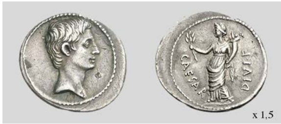
Fig. 5. Denario de Octaviano. Anv. Cab. de Octaviano. Rev. Fig. de Pax. Brundisium o Roma. RIC I 2 252 3,71 g 11 h. Classical Numismatic Group, Inc. 07/01/2008 lote 640.