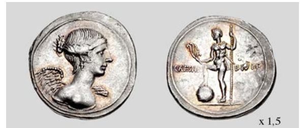
Fig. 10. Denario de Octaviano. Anv. Busto de Victoria. Rev. Fig. de Octaviano. Brundisium o Roma. RIC I2 256 3,75 g 3 h. Classical Numismatic Group, Inc. 07/01/2013 lote 989.

Zanker por su parte también ofreció este mismo esquema describiendo la perfección de la situación de este modo: