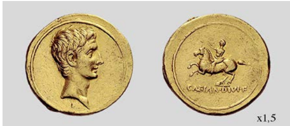
Fig. 15. Áureo de Octaviano. Brundisium o Roma. RIC I 2 262 7,74 g. Numismatica Ars Classica NAC AG 04/04/2011 lote 867.

con el brazo derecho extendido en señal de adlocutio ( RIC I 2 262) (fig. 15). Sutherland no dudó, al calificarla como very easily explicable , de que la iconografía de esta emisión debía interpretarse como Octaviano en el papel de dux durante una salutación a las tropas o como su llegada triunfal a Roma en agosto del 29 a.C. (Sutherland 1976: 149).