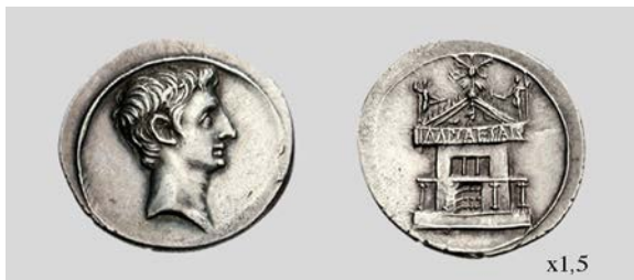
Fig. 22. Denario de Octaviano. Brundisium o Roma. RIC I 2 266 3,75 g 10 h. Classical Numismatic Group, Inc. 07/01/2008 lote 653.

con elementos de botín (Dio Cass. 51, 22, 1-2). En la parte delantera de la Curia se construyó además un pórtico frontal del que todavía quedan marcas de la sustentación del tejadillo en la fachada y los apoyos de las basas de las columnas en el pavimento. A pesar de que la Curia Iulia fue completamente destruida en el incendio de Carino del año 283 d.C, fue restituida a imagen y semejanza de la antigua Curia por Diocleciano en el año 303 d.C. La emisión RIC I 2 266 (fig. 22), ampliamente debatida (cfr. Malacrino 2004) parece ajustarse perfectamente a la descripción antes aportada de la Curia, todavía en pie en el Foro Romano (Sutherland 1976: 154; Zanker 1987: 104-105; Malacrino 2004).