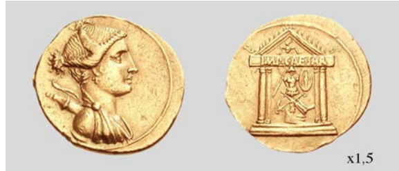
Fig. 11. Áureo de Octaviano. Brundisium o Roma. RIC I 2 273 7,5 g 6 h. Classical Numismatic Group, Inc. 07/01/2008 lote 651.

c. 36-35 a.C. por lo que la fecha de c. 34 a.C. parece la más probable para un posible inicio de las primeras emisiones CAESAR DIVI F e IMP CAESAR por el vacío numismático que se produciría entre el año 34 a.C. y la batalla de Actium , momento en el que Octaviano habría tenido que pagar a una gran cantidad de tropas, lo cual le habría acarreado una situación de precariedad económica. Más adelante comentaremos cuales fueron las medidas que se tomaron.