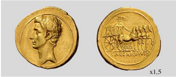
Fig. 18. Áureo de Octaviano. Brundisium o Roma. RIC I 258 7,98 g. Numismatica Ars Classica NAC AG 07/10/2009 lote 302.

del carro. Sin embargo, debemos notar que los laterales del carro en las emisiones RIC I 263-264 ( vid. figs. 19 y 20) presentan unas figuras de estilo similar, teniendo la seguridad, en ese caso, de que se trata de un carro triunfal montado por Octaviano, otorgando más verosimilitud a los planteamientos de Crawford y Sutherland.