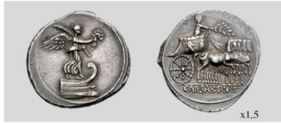
Fig. 19. Denario de Octaviano. Brundisium o Roma. RIC I 263 3,69 g. Hess-Divo AG 04/05/2009 lote 1505.