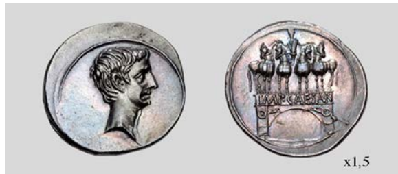
Fig. 21. Denario de Octaviano. Brundisium o Roma. RIC I 267 3,83 g 5 h. Classical Numismatic Group, Inc. 03/01/2011 lote 612.

El 28 de agosto del año 29 a.C., tan solo unos pocos días después del triple triunfo, Octaviano inauguró la Curia Iulia , finalizando así la construcción que había comenzado César en el año 44 a.C. En su interior se colocó la famosa estatua de la Victoria traída desde Tarento que se adornó