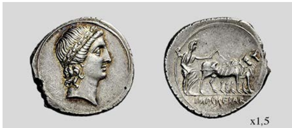
Fig. 17. Denario de Octaviano. Brundisium o Roma. RIC I 2 272 3,72 g. Numismatica Ars Classica NAC AG 17/05/2012 lote 1004.

que nos permita relacionarlo con la fundación de Nikopolis. A pesar de que la cabeza de Apolo del anverso podría indicar que nos encontramos en un momento posterior a la victoria de Actium , no podemos estar seguros de ello puesto que tras la batalla de Naulochus también fueron licenciados y establecidos en colonias una gran cantidad de hombres (Apiano Bell. Civ. 5, 13, 129; Dio Cass. 49, 13-14) (Gurval 1995: 59). Por otra parte, Laffranchi (1919: 16) interpretó el tipo como alusión a la extensión del pomerium de Roma por parte de Octaviano. Más recientemente Assenmaker, ha dudado de esta interpretación limitando su hipótesis a la representación de Octaviano en relación con Rómulo, fundador de Roma, asociando la cabeza de Apolo del reverso con la promesa de la construcción de un templo en su honor en el Palatino (Dio Cass. 49, 15, 5) la colline romuléenne par excellence (Assenmaker 2008: 68-69).