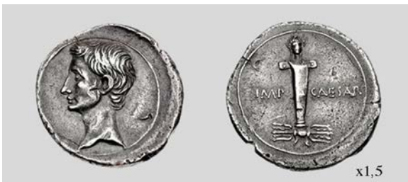
Fig. 24. Denario de Octaviano. Brundisium o Roma. RIC I 2 269b 3,83 g 3 h. Classical Numismatic Group, Inc. 18/09/2013 lote 1006.

Sin embargo, debemos pensar que la emisión áurea debía constituir una representación de detalle tan solo de la estatua, haciendo referencia a la victoria universal como muestra el globo sobre el que se encuentra. A pesar de todo, la emisión RIC I 2 266 presenta dos figuras en los laterales del frontón de la Curia acompañando a la Victoria. Zanker y más recientemente Malacrino han apuntado que estas estatuas portan sendas lanzas hacia el exterior y un ancla y un remo hacia el interior, elementos característicos de los trofeos navales; tal vez los mismos que menciona Dion Casio como parte del botín egipcio (Zanker 1987: 104). En conclusión, los datos de que disponemos actualmente nos llevan a pensar que aun con los problemas que plantean, las emisiones RIC I 2 266 y 268 representan respectivamente la Curia Iulia y la Victoria de Tarento, en conmemoración de su inauguración el 28 de agosto del 29 a.C. por lo que su acuñación debió llevarse a cabo probablemente en este año.