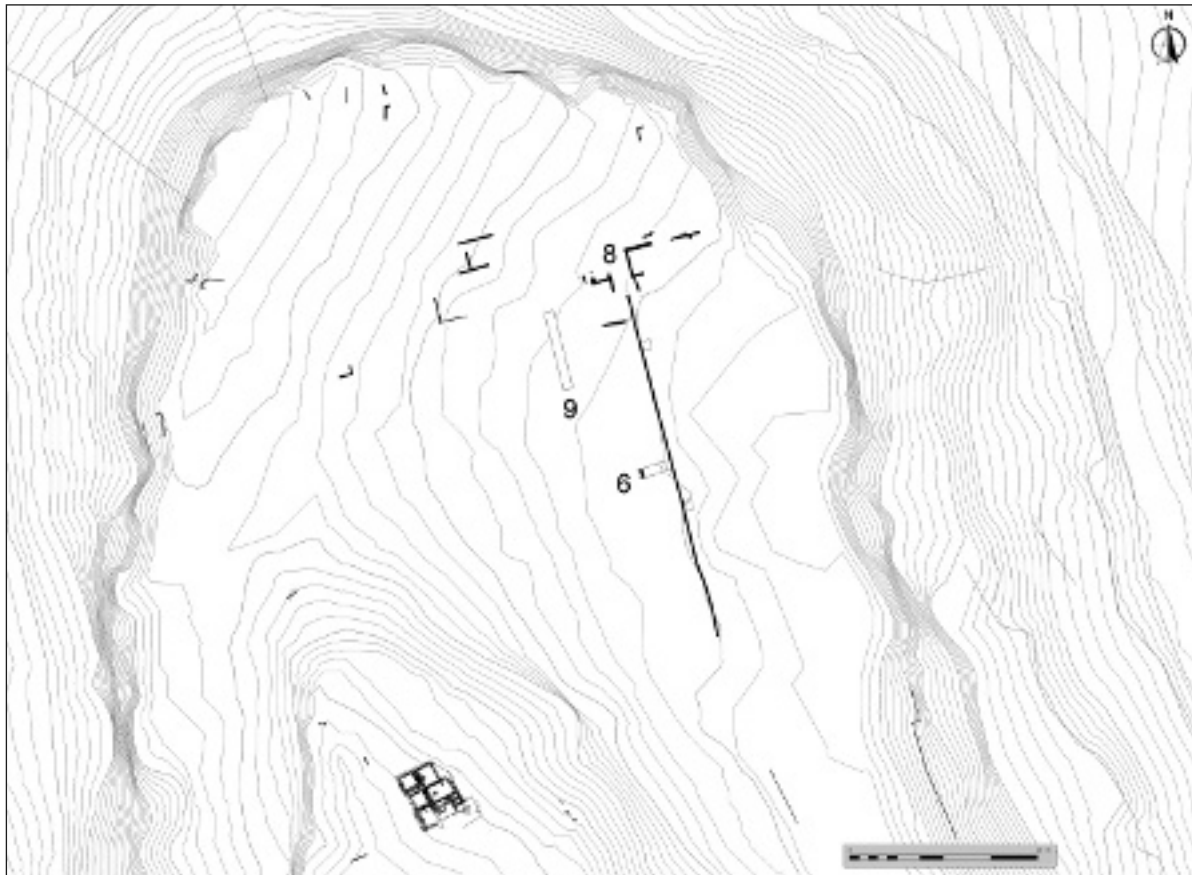
Fig. 1. Plànol topogràfic del sector nord de la Moleta amb la localització dels sondeigs on s'ha treballat en la campanya de 2009.

s'haja buidat abans de la construcció de l'edifici al qual pertany l'esmentada cimentació, pot considerar-se l'evidència que tota la zona fou sotmesa a una profunda preparació prèvia a l'erecció dels edificis que hi degué haver. D'altra banda, una datació entre els regnats d'August i Tiberi s'adequa amb la que pot suposar-se per a la monumentalització de la ciutat com a conseqüència de la concessió de l'estatut municipal en la segona meitat del regnat d'August. Finalment, cal destacar l'alt grau d'arrasament que presenten les estructures de caràcter monumental que existien en aquesta terrassa i que, cada vegada amb més probabilitats, podem atribuir al fòrum del municipi.