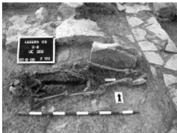
Fig. 3. Inhumació excavada en el sondeig 8 (UE 808).