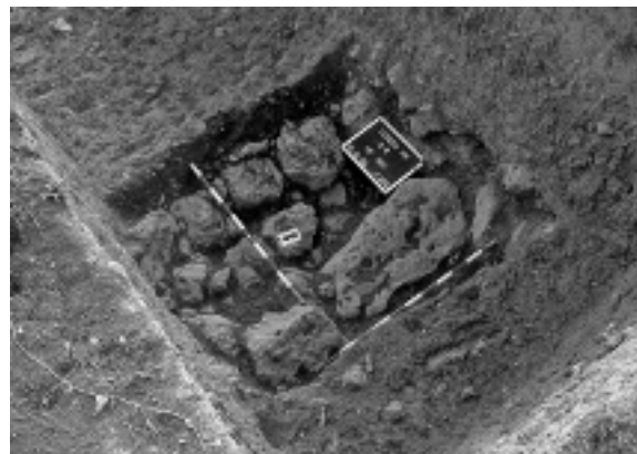
Fig. 2. Cimentació trobada en el sondeig 6 (UE 609).

d' opus caementicium que divideix les terrasses central i inferior del sector NE de la Moleta. En la campanya del 2008 es van trobar dues inhumacions que mostraven la utilització d'aquesta zona com a necròpolis d'una alqueria andalusina,