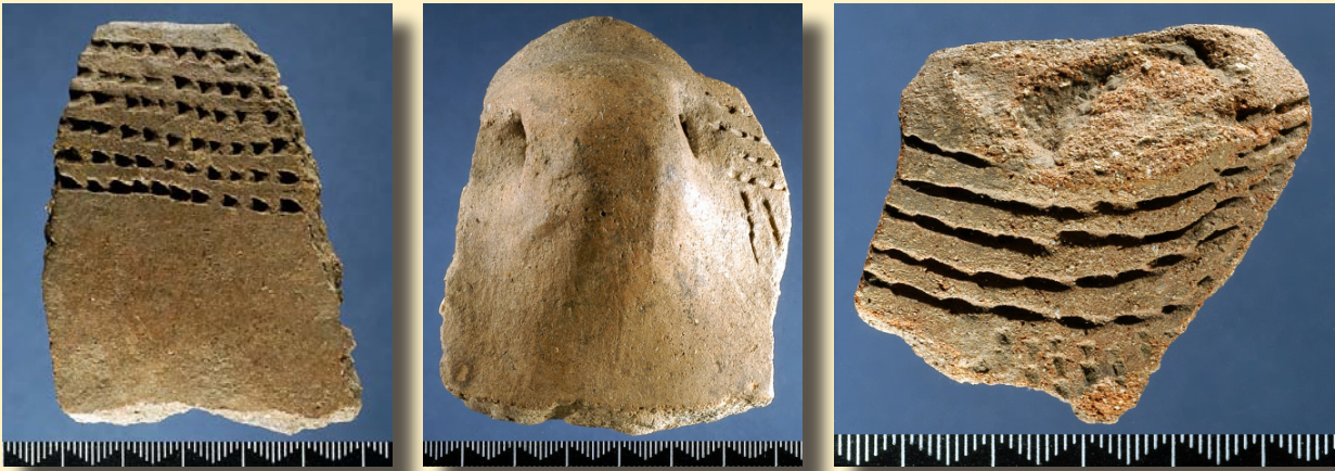
Figura 4. Fragmentos de cerâmica boquique da Valada do Mato.

claramente dominante, parece opor-se um outro constituído por cerâmicas que mais que incisões, apresentam fiadas de caneluras paralelas ao bordo. O significado etno-histórico desta diversidade estilística não pode ser recuperado uma vez que a posição secundária de recuperação dos fragmentos cerâmicos desconecta estes dos lugares específicos de uso dos recipientes.