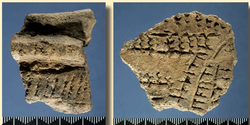
Figura 3. Fragmentos de cerâmica cardial da Valada do Mato.

Na Valada do Mato, a cerâmica cardial e a cerâmica boquique representam estilos minoritários num conjunto dominado pelas impressões de múltiplas fiadas, em banda aberta, de distintas matrizes. A este grupo decorativo,