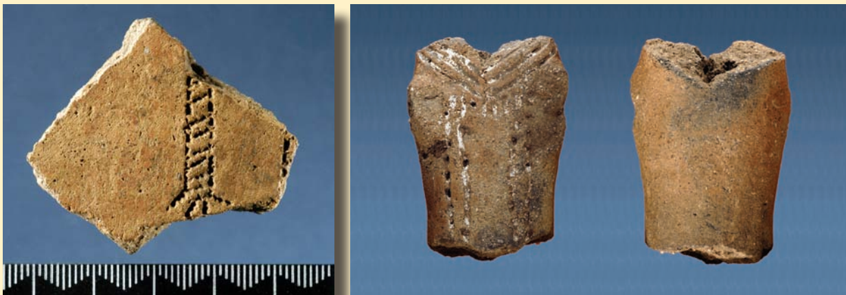
Figura 2. Fragmento com “orante” e figurinha antropomórfica.

do Mato enquadraram-se num projecto de investigação que procurou a partir deste lugar central discutir as modalidades de neolitização do Sul de Portugal tendo sido publicados os dados obtidos, e as problemáticas levantadas, em diferentes momentos (Diniz, 2000, 2001a, 2001b, 2003, 2007, 2008a, 2008b, no prelo; Diniz e Angelucci, 2008; Diniz e Calado, 1997; Diniz e Vieira, 2007; Gibaja et al. , 2002).