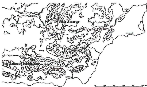
Figura 1. Situación geográfica de los dos asentamientos.

Está localizado en el sector oriental de la comarca de Alhama, en los denominados secanos del Temple, en contacto con el borde meridional de la Vega de Granada, con una altitud media de 700 m.s.m., y la máxima de 880 m., que corresponde al Cerro de la Atalaya, desde donde se avistan la Vega de Granada y las tierras del Temple, comarcas que se conectan a través del arroyo del Salado, que forma un pasillo entre las elevaciones del glacis del borde meridional de la Vega de Granada, siendo una zona natural de paso que une la Vega de Granada con las tierras de Alhama (fig. 1). La salinidad de las Aguas de este arroyo da lugar a unas salinas explotadas desde antiguo (Trillo, 1992).