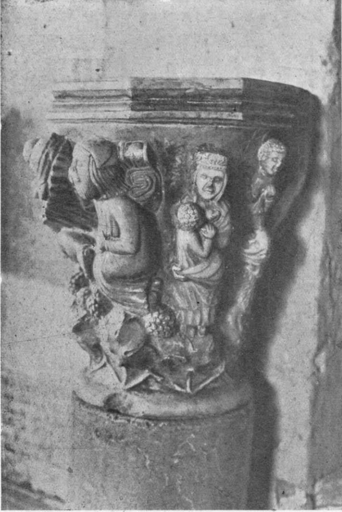
Detalle de la pila en que se ven motivos que no figuran en la reproducción dibujada del P. Villanueva.