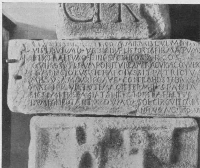
Epígrafes en monumentos públicos. - Núm. 6