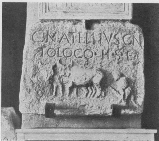
Epígrafes sepulcrales - Núm. 51