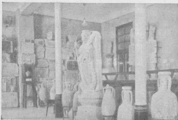
Museo de Cartagena. - Vista parcial