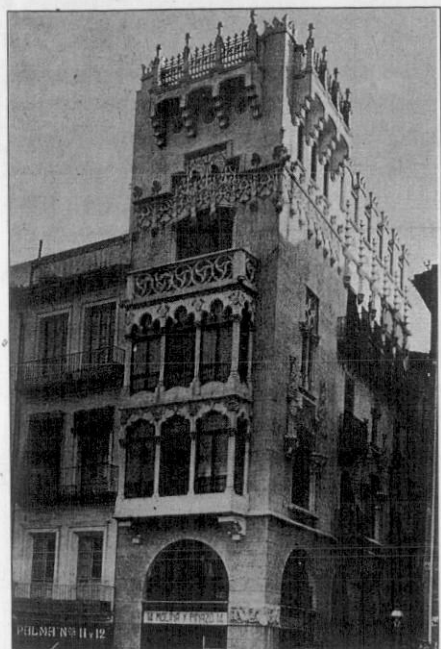
Foto 1.- Palacio Municipal de la Exposición Regional de 1909. Francisco Mora