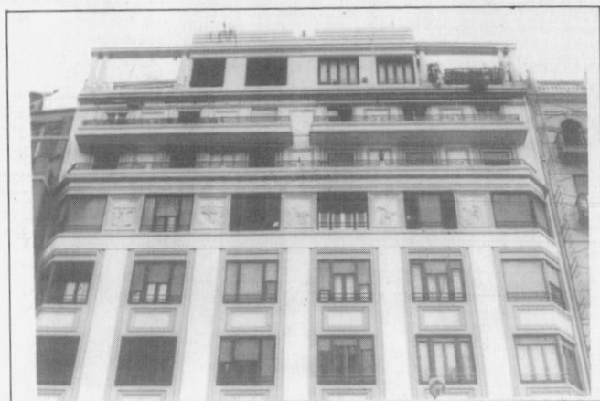
Foto 8.- Casa García (1930). Luis Albert. Detalle del remate de la fachada