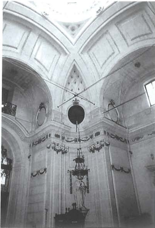
FIG. 1 – ELCHE. Capilla de la Comunión de la Basílica de Santa María . Alzado del interior.

Por la Venerable Junta, Bartolomé Ibáñez Gil, Secretario”.