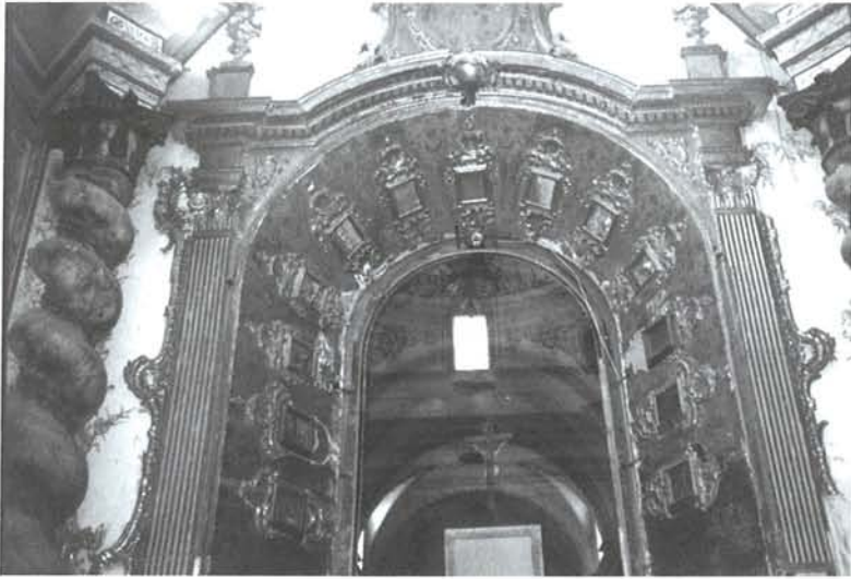
FIG. 4 – YECLA. Contrarretablo del camarín de la Virgen de las Angustias , obra de 1769 de José González de Coniedo. (Foto Javier Delicado).