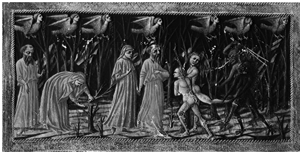
Figura 4. El bosque de los suicidas, Códice Yates Thompson, 36. Priamo della Quercia. 1444-1452.