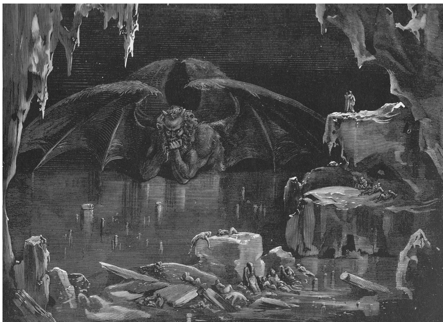
Figura 2. Infierno, canto XXXIV, Lucifer. Gustave Doré. 1832.