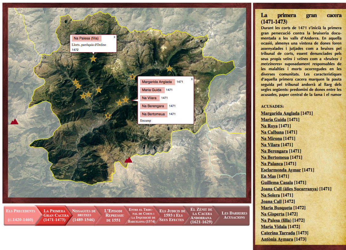
Fig. 4 Captura de pantalla de l'atles interactiu http://terradebruixes.cultura.ad/index.php/atles

major nombre d'actuacions judicials, s'ha incorporat també una llegenda amb diversos tons cromàtics per indicar els anys de celebració de les corts.