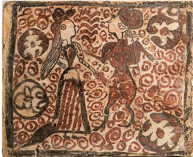
FIG. 3: Socarrat decorat amb òxid de ferro i manganés, Paterna, segle xv. S'hi representa una escena de tema eròtic. La dama de l'esquerra, amb tota probabilitat una prostituta, acaricia el penis de la figura masculina de la dreta [Barcelona, Museu del Disseny, núm. inv. MCB 19489].