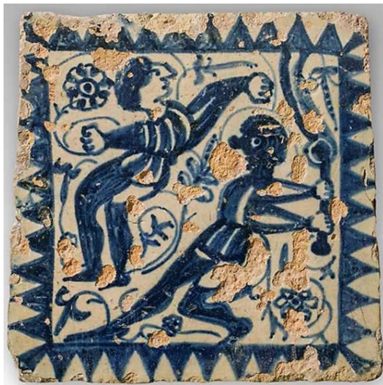
FIG. 6: Joglars fent funambulismes. L'acròbata amb el rostre negre (segurament morisc) sembla que llance el seu company perquè faça equilibris. Rajola en blau i blanc de la sèrie de puntes de serra, procedent del palau dels Boil de Manises, darrer quart del segle XV [Barcelona, Museu del Disseny, núm. reg. MCB 52152; fotografia: Guillem Fernández-Huerta].