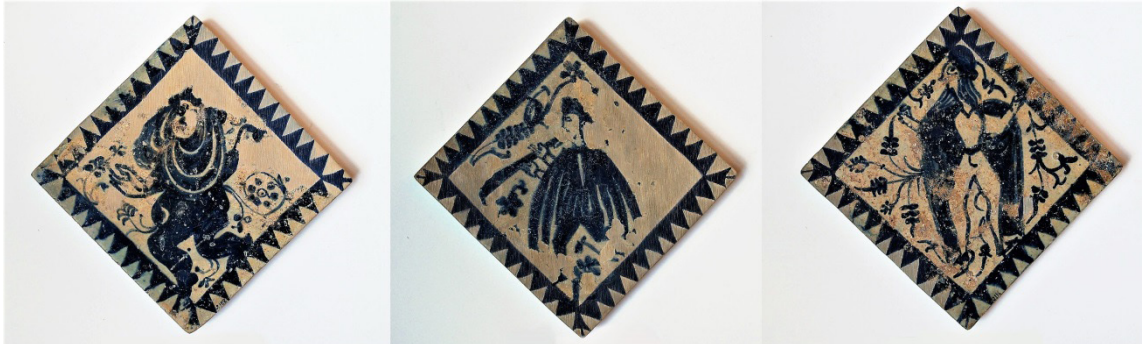
FIG. 5: Rajoles del palau dels Boil procedents dels tallers de Manises, mitjan s. xv. Ceràmiques ornamentals de la sèrie blava orlades amb puntes de serra. D'esquerra a dreta: figura femenina amb vestidures d'estil morisc que mostra una actitud corèutica, músic amb un instrument de vent lleugerament cònic, i donzell amb posat corèutic [València, Museu Nacional de Ceràmica i Arts Sumptuàries González Martí, núm. inv. CE1/02108, CE1/02109 i CE1/02112].