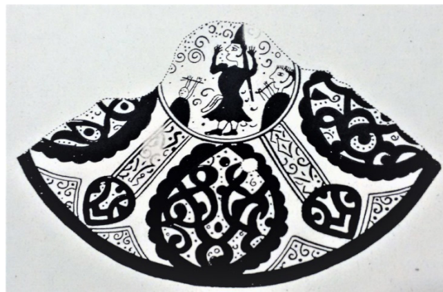
FIG. 4 : Singular ceràmica dels tallers de Manises, primera meitat del segle xv. El cercle central il·lustra una sintètica escena protagonitzada per una ballarina –tal vegada una prostituta– abillada amb un vestit curt, ajustat amb un cinturó, que deixa veure clarament el calçat, uns botins de poca altura. El pentinat piramidal està rematat amb una mantellina o una trena que li arriba al nivell de la cintura. És peculiar el prominent rínxol que estilitza uns trets facials molt esquemàtics. La ballarina té els braços en alt i una actitud corèutica molt diferent de la de les dansaires cortesanes de la producció valenciana en verd i manganés. L'acompanya un joglar que fa sonar una espècie de flauta o oboè amb una terminació lleugerament sinuosa. El músic llueix els cabells en punta i el mateix rínxol que la ballarina. El tercer personatge, fet amb traços naïfs, té el cap completament pelat i sembla que realitza uns exercicis malabars o, tal vegada, dirigeix el ball amb un bastó [Londres, British Museum; infografia realitzada a partir de González Martí (1944: 416, fig. 513)].