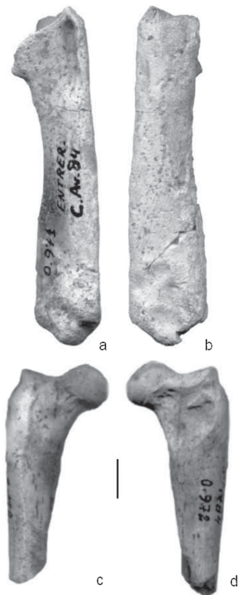
Figura 1. a- vista anterior y b- vista posterior de húmero izquierdo de Paraptenodytes antarcticus (Moreno y Mercerat, 1891), MLP 89-XII-25-1; c- vista anterior y d- vista posterior de fragmento proximal de fémur derecho. Spheniscidae indet. cf. Paraptenodytes sp. Ameghino, 1891, MLP 89-XII-26-1. La línea equiva- le a 1 cm.

a- anterior view and b- posterior view of a left humerus of Paraptenodytes antarcticus (Moreno y Mercerat, 1891), MLP 89-XII-25-1; c- anterior view and d- posterior view of a proximal fragment of a right femur Spheniscidae indet. cf. Paraptenodytes sp. Ameghino, 1891, MLP 89-XII-26-1. Scale bar = 1 cm.